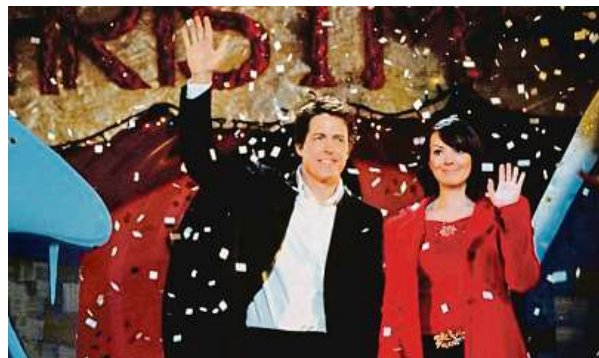
Hugh Grant si zahrál britského premiéra. Režisér Richard Curtis ho předtím obsadil i do filmů Notting Hill a Deník Bridget Jonesové.

Také v Láске nebeské našli fajnšmekři celou řadu chyb. Z jedné udělal režisér Curtis vtip. Když totiž David vchází poprvé do Downing Street, jeho kravata dozná jedenáctkrát změnu. Grant si totiž kravatu v obědové pauze vyměnil a nikdo si toho nevšiml.