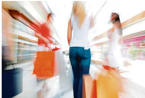
Nakupováním podporujeme také znečišťování planety.

Právě proto je nakupování ve fast fashion často podnětem ke zmíněnému zahanbování. Na druhou stranu, móda od udržitelných zna-