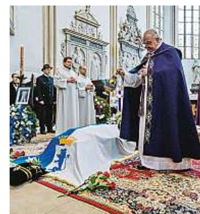
Poslední rozloučení s Hugem Mensdorffem-Pouillym