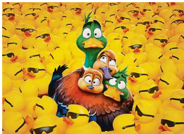
Není kachna jako kachna. Do českých kin se nový animovaný snímek podívá příští čtvrtek 21. prosince.

né nadprůměry vypilovalo k dokonalosti? Zhruba něco takového bych čekal od novinky tvůrců Mimoňů, která si bere na paškál koncept migrace ptáků a dává mu spin většiny klasických pixarovek. A bude to zjevně opět bavit hlavně ty nejmladší,“ píše na webu Moviezone.cz jeho redaktor Ondřej Mrázek alias dO od s tím, že by se vůbec nedivil, kdyby jej snímek od studia Illumination bavil víc jak poslední snímky od konkurenčního Pixaru.