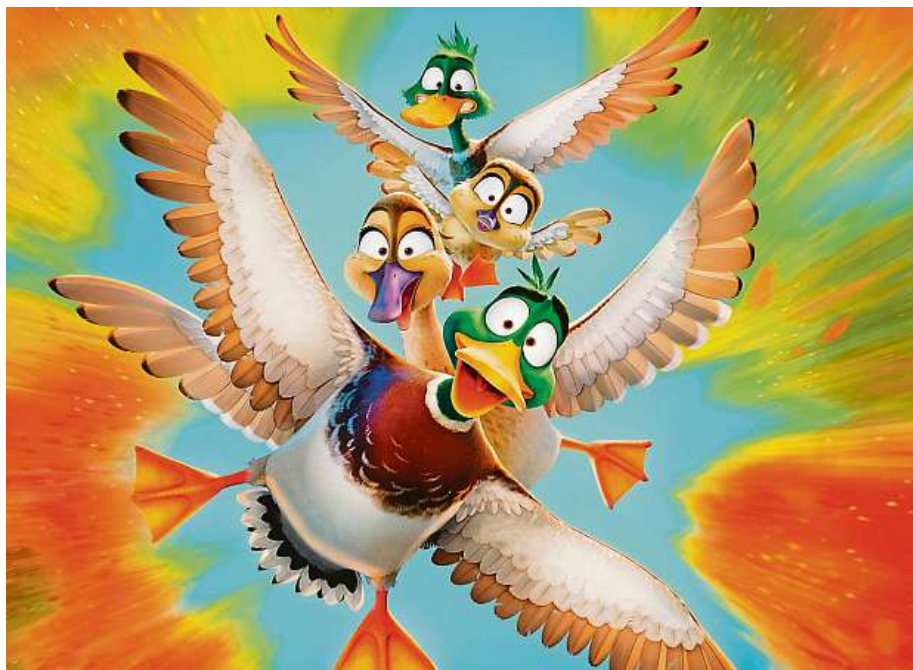
Rodina kachen přesvědčí svého příliš ochranního otce, aby si dopřáli dovolenou v Karibiku. Vše se zdá snadné jen do té chvíle, než se jim do cesty připloune nebezpečné ulice New Yorku.

Podle celé řady filmových kritiků zijeme v době, kdy v kinech, alespoň co se animáků týče, převažuje kvalita nad kvantitou. Proto je třeba vyzdvihnout fakt, že se na Ptáčích stěhovavých podílejí tvůrčí oblíbených Mimoňů. „Lehký animovaný nadprůměr od studia, které lehké animova-