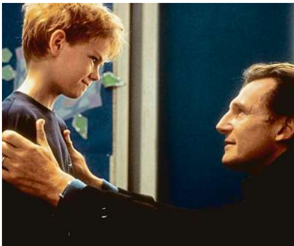
Thomas Brodie-Sangster jako Sam a Liam Neeson v roli Daniela, Samova nevlastního otce