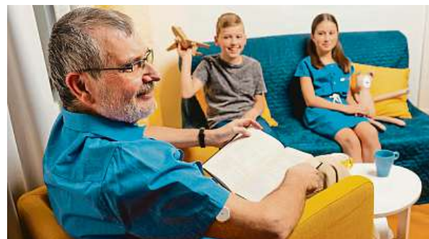
Nejrizikovější je kombinace alkoholu a fyzické námahy. FREESTYLE LIBRE

Zdaleka nejrizikovější pro diabetiky je kombinace alkoholu a zvýšené fyzické námahy. Tedy například vánoční večerek plný tance či horská túra. V těchto případech by měli cukrovkáři alkoholické nápoje rozhodně vynechat. Navíc pokud člověk pije, tak se často nehlídá a „ztrácí zábrany“. Je proto pro diabetiky velmi důležité kontrolovat své hodnoty cukru, obzvláště během konzumace alkoholu. Kontrolovat hladinu glykémie v krvi lze pomocí