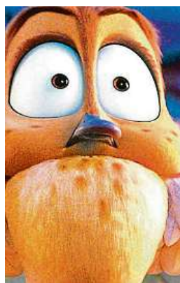
Kachní rodinka se vydá krapet špatným směrem.