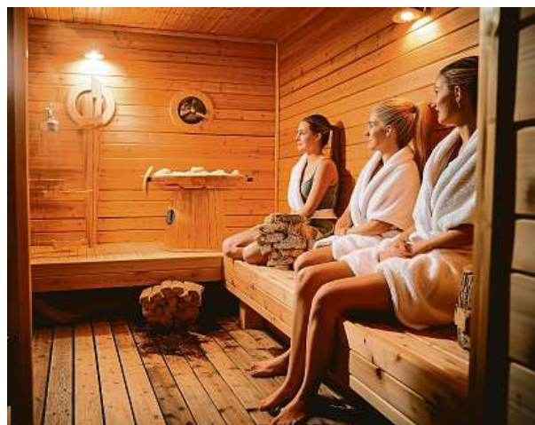
Sauna pomůže s imunitou i regenerací těla.

„Ženy mohou využívat saunu v premenstruační i menstruační fázi cyklu pro zmírnění symptomů spojených s premenstruačním syndromem – saunování v tomto období rozhodně není při současných menstruačních potížích tabu. Častější a dlouhodobé saunování zároveň napomáhá k pravidelnosti menstruačního cyklu i k rovnováze ženských hormonů progesteronu a estrogenu, protože snižuje chronickou nadprodukcii a vyplavování stresových metabolitů kortizolu a adrenalinu,“ upozor-