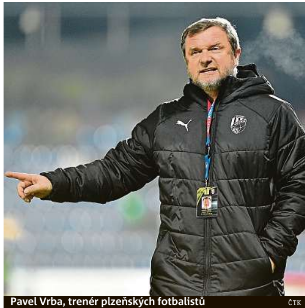
Pavel Vrba, trenér plzeňských fotbalistů

„Samozřejmě dáme do toho všechno, určitě bude plný stadion. Je to na nás, máme to ve vlastních rukách a věřím, že nám i fanoušci po-