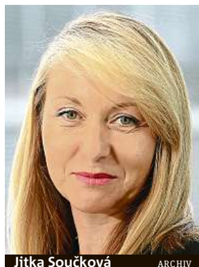
Jitka Součková ARCHIV

Uchazeč musí vědět, co konkrétně bude jeho pracovní náplní. Často se totiž stává, že inzerát na pracovní pozici vytváří HR oddělení, nikoliv budoucí nadřízený, a popis pracovních povinností se proto může od reality lišit. Pohovor je tedy pro uchazeče ideální příležitostí, jak zjistit všechny detaily, a to včetně cílů, kterých by měl v dané práci dosáhnout, aby byl manažer s jeho výkonem spokojený.