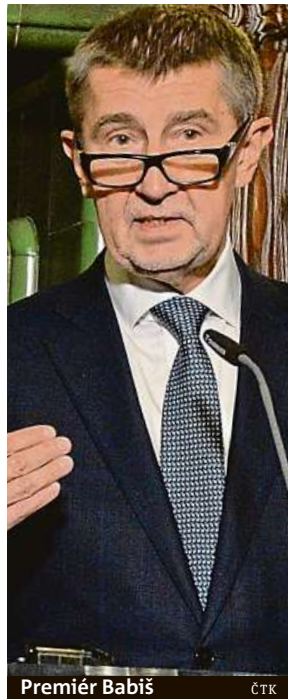
Premiér Babiš

mne je ta kauza uzavřená, Andrej Babiš vyčerpal veškeré procesní prostředky, veškeré instance a zůstává dál registrovaným agentem StB,“ uvedl. Podle něho je paradoxní, že v jednom týdnu se českým premiérem a jeho kauzami zabývají obě evropské instituce, jak Rada Evropy, pod kterou soud spadá, tak Evropská unie. Evropský parlament se bude totiž dnes zabývat Babišovým údajným střetem zájmů. „Bohužel tyto mezinárodní kauzy českého premiéra Českou republiku jako takovou poškozují,“ konstatoval. Ani předseda STAN Petr Gazdík nečeká, že by oznámení nějak otrásl Babišovou domácí pozici. „Vypadá to na dost špatný týden pro českého premiéra, který ve snaze okecat svou roli ve svazcích StB neváhal použít nástroj dosud nevídaný – zažalovat celý soudní stát. Neměl by premiér (Peter) Pellegrini chtít pro Slo-