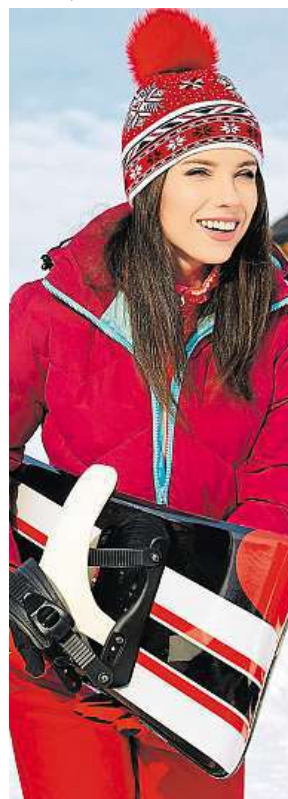
Pozor na úsměv!

Podobné problémy evidují pojišťovny i na domácích sjezdovkách. V případě kolize je důležité vše vyfotit, případně nakreslit plánek, vzít si kontakty na svědky, záležitost ohlásit horské službě nebo policii. Vznikne-li podezření na požití alkoholu, je dobré trvat na testu. PH a MET