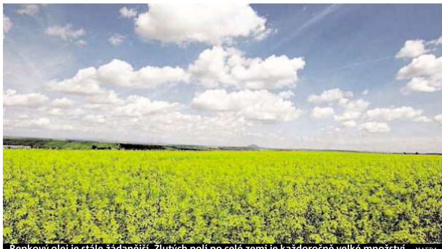
Řepkový olej je stále žádanější. Žlutých polí po celé zemi je každoročně velké množství.

Na druhou stranu jsou nedílnou součástí fyziologických procesů organismu, jako je třeba syntéza hormonů.