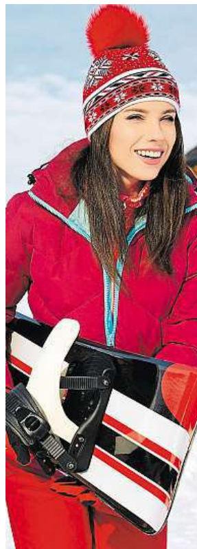
Pozor na úsměv!

Podobné problémy evidují pojišťovny i na domácích sjezdovkách. V případě kolize je důležité vše vyfotit, případně nakreslit plánek, vzít si kontakty na svědky, záležitost ohlásit horské službě nebo policii. Vznikne-li podezření na požití alkoholu, je dobré trvat na testu. PH a MET