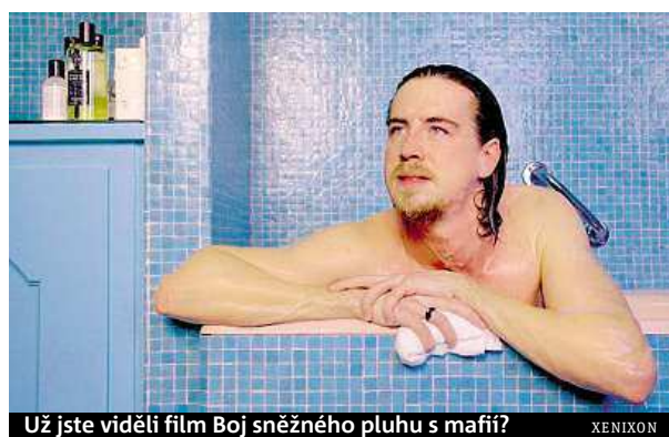
Už jste viděli film Boj sněžného pluhu s mafii? XENIXON