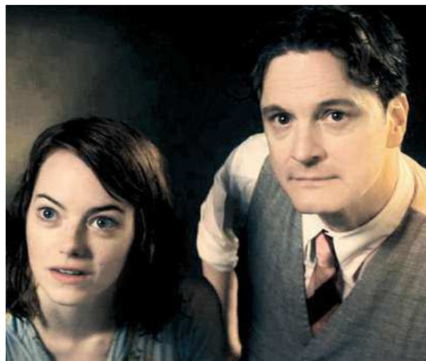
Diváci si oblíbili i Allenův film Kouzlo měsíčního svitu.

Uvedena bude i akční černá komedie Boj sněžného pluhu s mafii od norského režiséra Hanse Pettera Molanda se severskou hvězdou Stellanem Skarsgardem v hlavní roli.