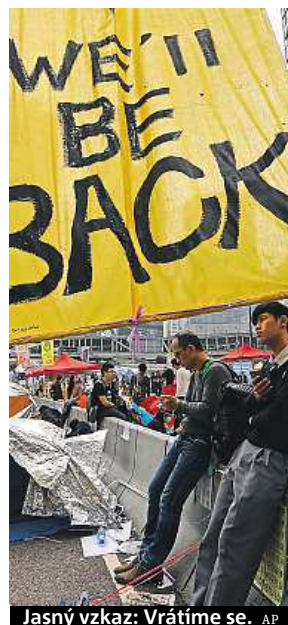
Jasný vzkaz: Vrátime se.

Hongkongští policisté vtrhli do protestního tábora prodemokratických aktivistů.