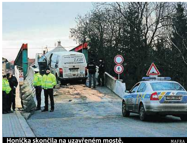
Honička skončila na uzavřeném mostě. MAFRA

Středočeská policejní mluvčí Štěpánka Zatloukalová uvedla, že se policisté auto snažili zastavit u Nové Vsi na