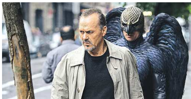
Oblíbeného superhrdinu Birdmana ve filmu ztvárnil Michael Keaton.