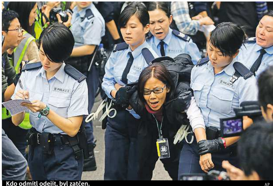
Kdo odmítl odejít, byl zatčen.