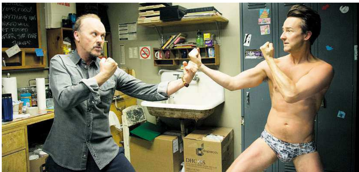
Nejvíce nominací (7) na Zlaté glóby, předzvěst favoritů na americké filmové ceny Oscar, získala komedie Birdman. Více strana 7

Exkluzivně. Byli jsme u nahrávání jmen nových stanic metra A. Kdopak to mluví. Seznamte se s hlasy, co denně slyšíte. Dvě ženy a muž. Prošli konkurzem. Natáčení. Trasa A na pásek, za béčko 500 korun STRANA 8