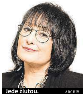
Jede žlutou.

Do konkurzu mě tehdy doslova donutili jít kolegové z televize. Já byla taková bázlivá, a přesto se v redakci vsadili, že konkurz vyhraji já. A měli pravdu. Z pětadvaceti lidí vybrali zrovna mě. Celé odpovědně jsem pak hlášení namulovala. Odměnou mi bylo 500 korun.