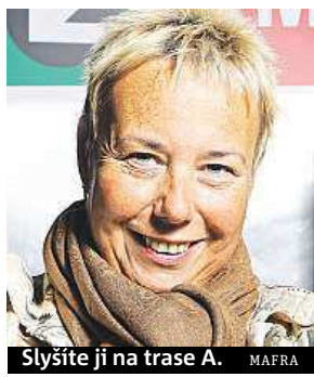
Slyšíte ji na trase A. MAFRA

Stejně jako před pár dny i před čtyřiceti lety jsem šla do depa na Kačerově. Zde jsme pak celé hlášení nahrávali ještě na pásku. Když jsem se přeřekla, museli jsme to celé natáčet znovu. Když už jsme to skoro celé měli nahrané, tak nám pod okny projel vlak a nahrávali jsme zase znovu. Hotovo jsme měli asi až ve tři ráno.