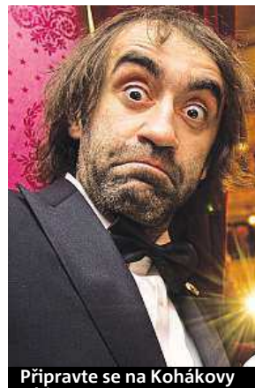
Připravte se na Kohákovy

Jak jinak než upřímně! Píšu to většinou na poslední chvíli, s editorským nožem na krku, za neustálého pláče šéfredaktora a kvílení grafiků. Ano, taková je pravda