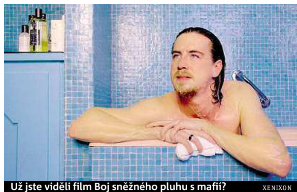
Už jste viděli film Boj sněžného pluhu s mafií? XENIXON