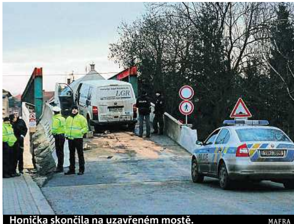
Honička skončila na uzavřeném mostě.

Středočeská policejní mluvčí Štěpánka Zatloukalová uvedla, že se policisté auto snažili zastavit u Nové Vsi na