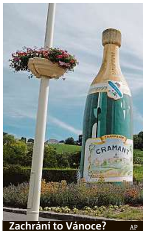
Zachrání to Vánoce?

Na své vinici v Dizy, ležící proti obci Hautvillers, kde mnich Perignon vynalezl