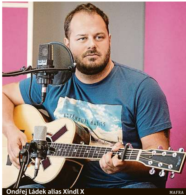
Ondřej Ládek alias Xindl X