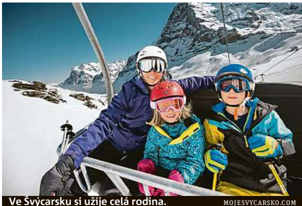
Ve Švýcarsku si užije celá rodina.

Ušetřit můžete také na ubytování, když využijete hustou síť mládežnických ubytoven