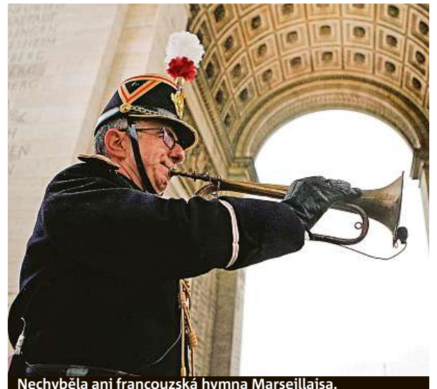
Nechyběla ani francouzská hymna Marseillaise.