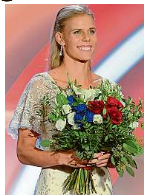
Nikola Ogrodníková

Českou atletkou roku je znovu oštěpařka, tentokrát Nikola Ogrodníková. Vicemistryně Evropy a medailistka z mítinků Diamantové ligy získala v anketě atletických funkcionářů, trenérů a novinářů 1225 bodů a nechala o více než sto bodů za sebou stříbrnou chodkyni z ME Anežku Drahotovou. Díky tomu na trůnu vystřídala devítinásobnou vítězku Barboru Špotákovou. Ta tuto sezonu kvůli mateřským povinnostem vynechala. Třetí příčku obsadil koulář Tomáš Staněk.