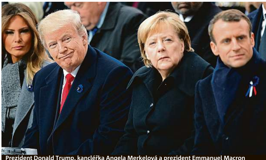
Prezident Donald Trump, kancléřka Angela Merkelová a prezident Emmanuel Macron