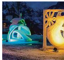
Sněhové sochy v rámci World Snow Festivalu rozzáří švýcarský Grindelwald od 21. do 26. ledna 2019.

do deseti let zdarma. VIP skipas je pro všechny, kteří se ubytují ve Samnaunu nebo Ischglu. Do šesti let věku nemusíte kupovat skipasy v areálech Charmey, Villars-Gryon, Arosa-Lenzerheide, Les Diablerets, Moléson, Leysin a v Savogninu, kde děti do devíti let v doprovodu rodičů lyžují s Flurin ticket za pět