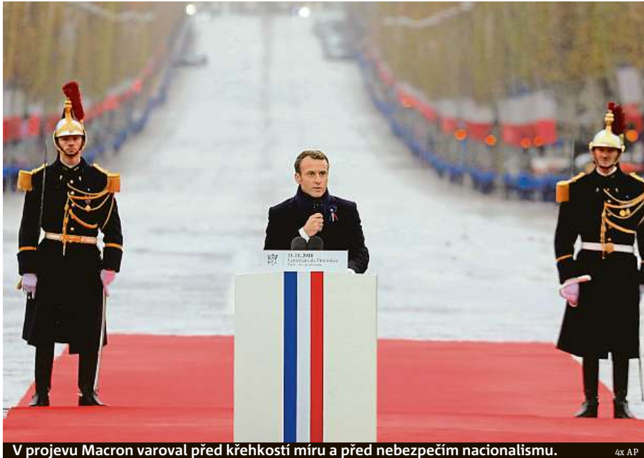
V projevu Macron varoval před křehkostí míru a před nebezpečím nacionalismu.

Po příchodu k oblouku si rukou potřásli americký prezident Donald Trump a jeho ruský kolega Vladimir Putin. Původně se předpokládalo, že se v Paříži sejdou ke krátké schůzce, což ale bylo odřeknuto. Velká vojenská přehlídka se v rámci výročí nekonala. Macron si totiž nepřál dát ceremonii příliš vojenský ráz, aby se tak nedotkl Berlína jako poražené strany. ČTK