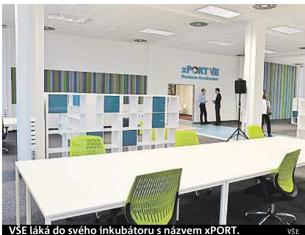
VŠE láká do svého inkubátoru s názvem xPORT. VŠE

Inkubátor České zemědělské univerzity ve spolupráci s inkubátory ČVUT a VŠE začal ještě dále. Již podruhé se zapojí do jedné z největších celosvětových událostí pro podnikatele, startupy a všechny zájemce o rozjetí vlastního byznysu – Týdne podnikání