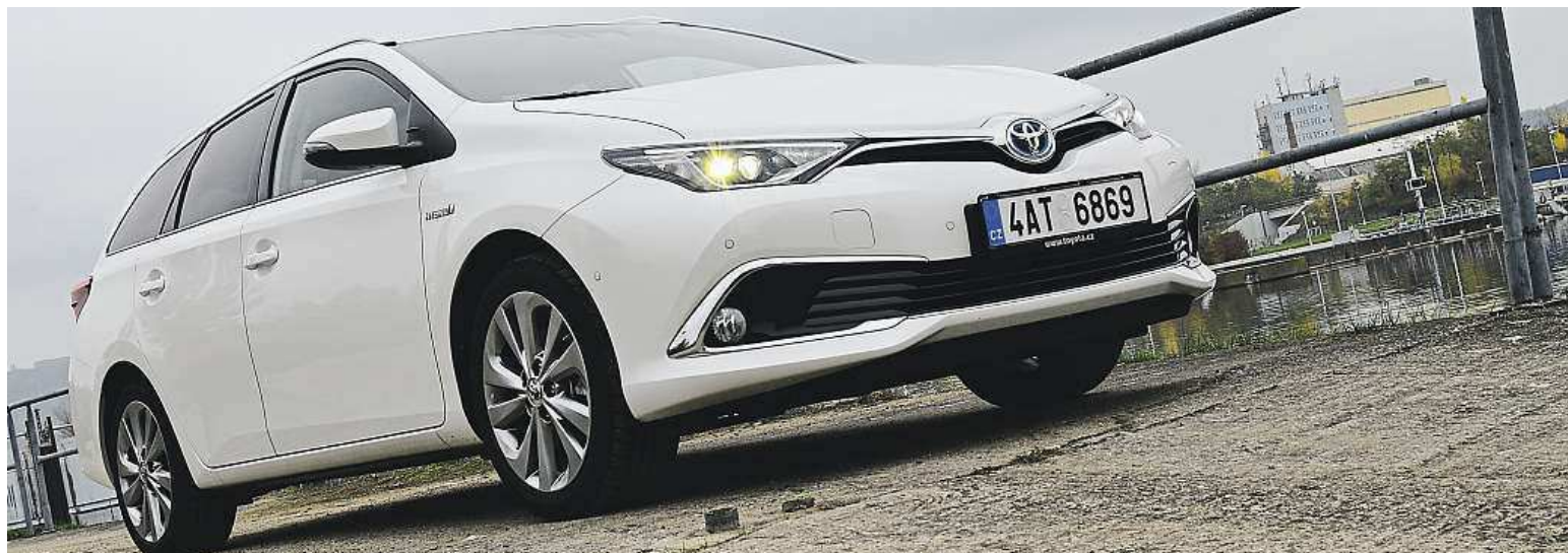
Oproti minulé generaci se na novém aurisu vzhledově mnoho neudálo. Změny hledejte spíše uvnitř auta, celý kokpit působí přívětivěji a logičtěji.