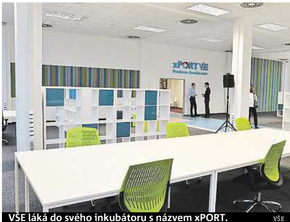
VŠE láká do svého inkubátoru s názvem xPORT. VŠE

Inkubátor České zemědělské univerzity ve spolupráci s inkubátory ČVUT a VŠE šel ještě dál. Již podruhé se zapojí do jedné z největších celosvětových událostí pro podnikatele, startupy a všechny zájemce o rozjetí vlastního byznysu – Týdne podnikání