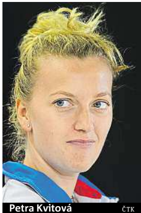
Petra Kvitová

ruského výběru Anastasii Myskinové, že všechny čtyři tenistky jsou připraveny na singl i debl. „Čtyřru? Já?“ reagovala Šarapovová, která hrála debla na turnaji WTA za minulých deset let jen jednou.