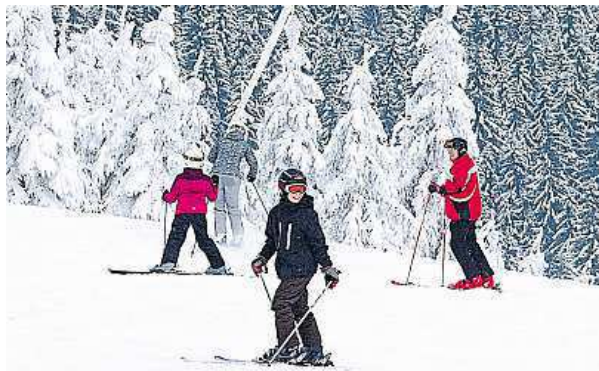
Takto se v lednu lyžovalo pod Ještědem.