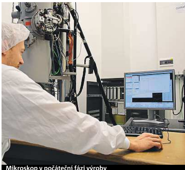
Mikroskop v počáteční fázi výroby