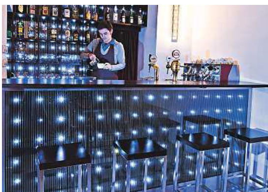
Kavárníka naleznete za osvětleným barem. V Tungstramu pak vsadili na proužkované stěny a velké dlaždice.

Na baru pod skleněnými poklopy obdivují sladké výrobky Kokina, malého brněnského cukrářství a pekařství. Brownies, košíčky s vanilkovým krémem a čokoládový