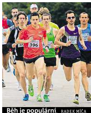
Běh je populární. RADEK MÍČA

V březnu příštího roku se uskuteční už posedmésáté jedno z největších sportovních klání svého druhu Běh Lužánkami. Ten jako tradičně zahajuje běžeckou sezonu v Brně. Než se ale stovky běžců 21. března postaví na start, mohou využít speciální nabídky. „Každou sobotu v Lužánkách chystáme tréninky pod vedením atletického trenéra. Zájemci se mohou systematicky po dobu pěti měsíců připravovat na závod