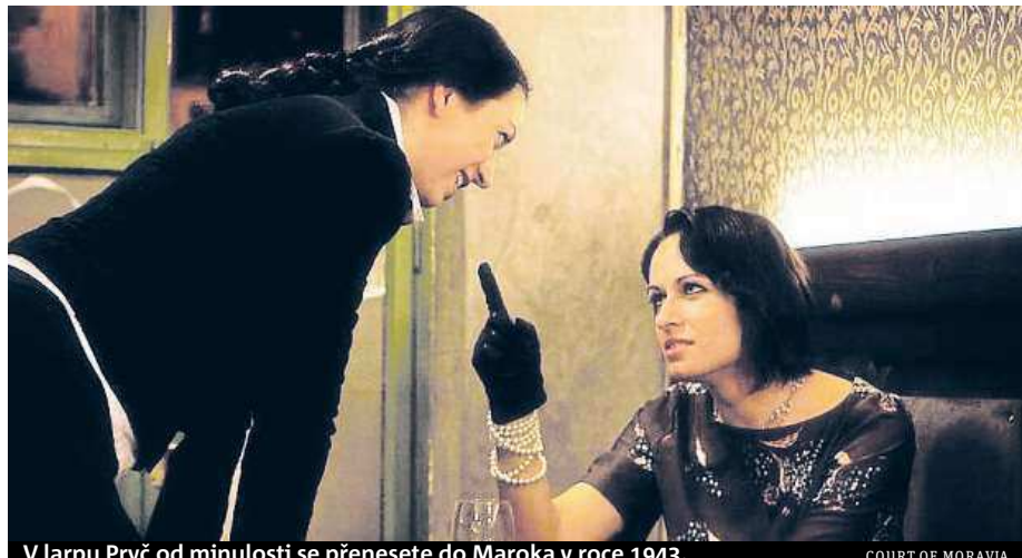
V larpu Pryč od minulosti se přenesete do Maroka v roce 1943.