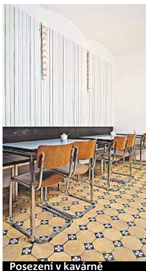
Posezení v kavárně