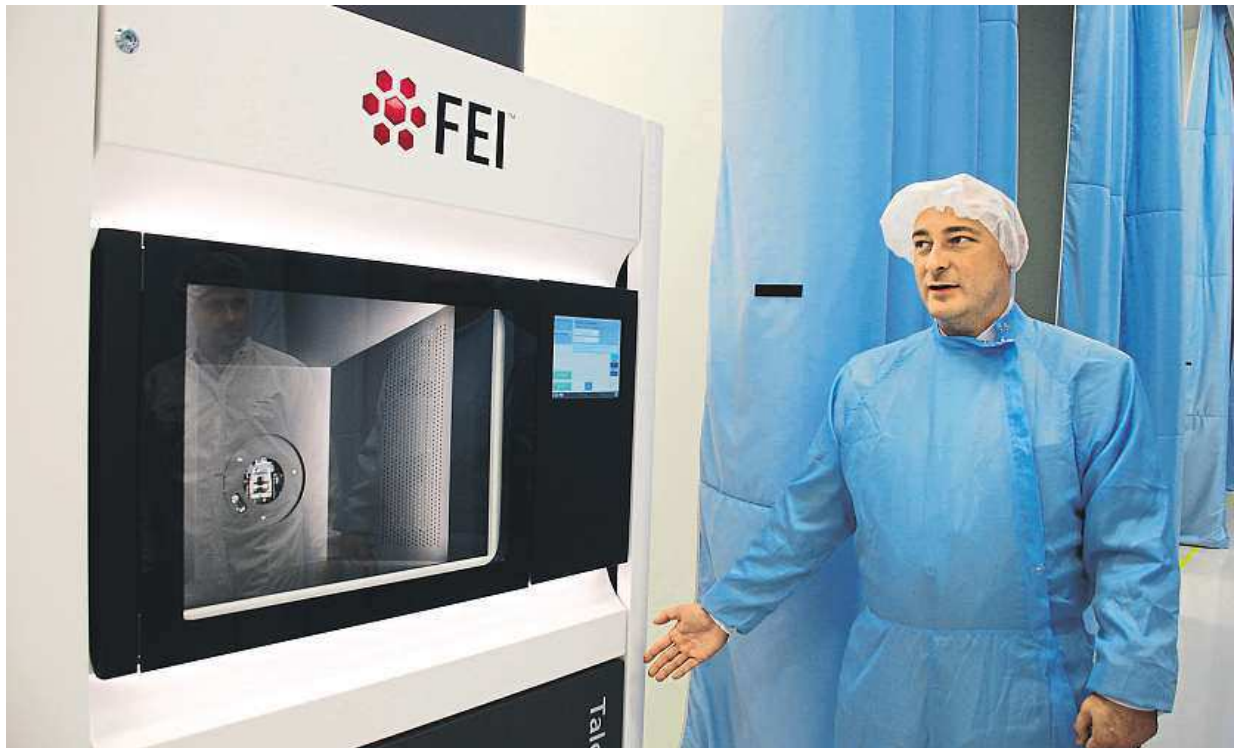
Takto vypadá elektronový mikroskop, který putuje k zákazníkům.

O pár minut později již vstupujeme do výrobních prostor. Každý pracovník tu musí mít ochranný oblek a ani pro návštěvy výjimky neplatí. Takže i my nazouváme na nohy igelity, oblékáme si jednorázovou kombinézu a na hlavu nasazujeme čepičku. Rázem si připadáme jako na exkurzi v nějaké potravinářské velkovýrobě. „Obleky tu nosíme kvůli minima-