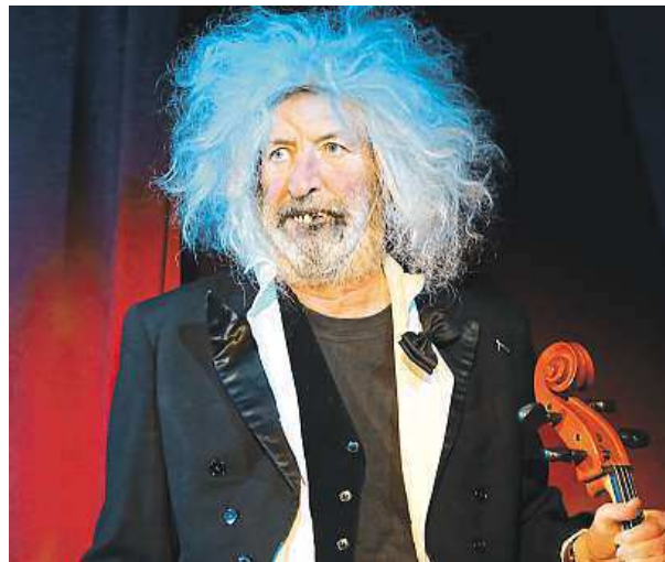
Díky Bolku Polívkově se můžete stát klaunem.

Klaunský program připravuje Divadlo Bolka Polívky . Kromě závěrečného večera festivalu klaunerie a nekompromisního humoru Přes čáru nabídnou program nazvaný Jak se dělá klaun. Návštěvníci si v něm vyberou rekvizi-