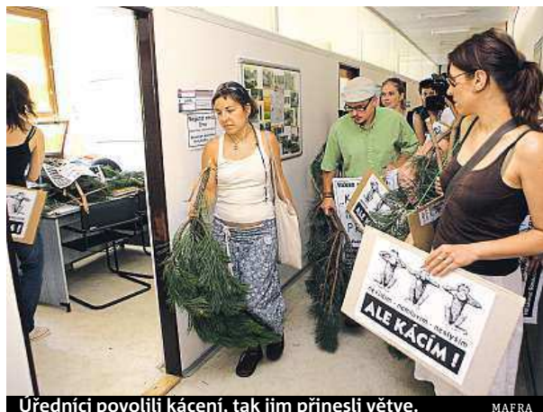
Úředníci povolili kácení, tak jim přinesli větve.

To je zastaralý způsob vnímání politiky, který jen čeká na to, aby byl odklizen na smetiště dějin. A to je už na spadnutí. BARBORA KOSINOVÁ