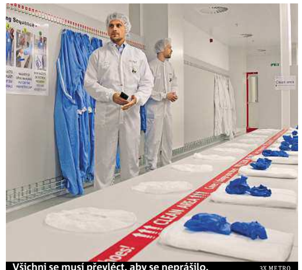
Všichni se musí převléct, aby se neprašilo.