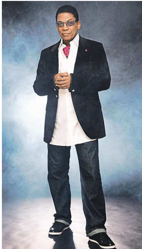
Na Harvardu přednáší o historické roli jazzu v diplomacii.