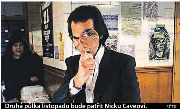
Druhá půlka listopadu bude patřit Nicku Caveovi.

Zvuk v nejnovějším formátu s označením 7.1 a 3D technologie. Brněnský Art investoval do novinek.