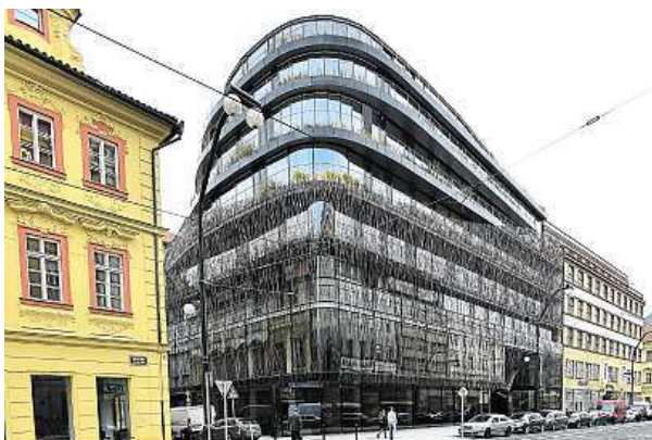
Restaurace a obchody v dolní části otevřou asi za dva měsíce.

„Nezdá se vám, že jim ty kovové části zrezly?“ komentuje matný kov konstrukce budovy Radoslav Novotný, který