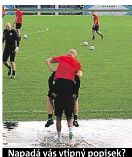
Napadá vás vtipný popisěk?

Napište bublinu a reagujte na sloupek na: www.facebook.com/denikmetro