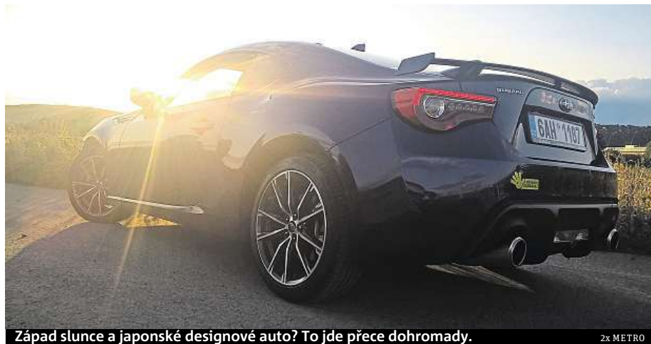
Západ slunce a japonské designové auto? To jde přece dohromady.