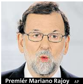
Premiér Mariano Rajoy

Španělská vláda chce po Katalánsku vysvětlit, jak bylo vyhlášení samostatnosti s odkladem myšleno.