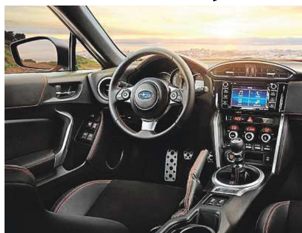
Interiér BRZ doznal lehkých změn.

Toho dosahuje svou nízkou váhou (1216 kg), nízko položeným motorem a vůbec celkovou konstrukcí. Téměř čtyři roky po uvedení na evropský trh je přenos váhy spolu s dynamickou odezvou podvozku jednou z nejlepších věcí, co může řidič zažít. Výkon vylepšeného dvoulitrového motoru zůstal také stejný, 200 koní a točivý moment 205 Nm při 6400 až 6600 otáčkách za minutu. A stabilizační systém jde naštěstí pořad úplně vypnout! PETR HOLEČEK