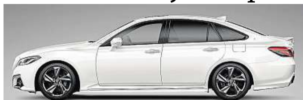
Koncept bude k vidění v lednu na tokijském autosalonu.