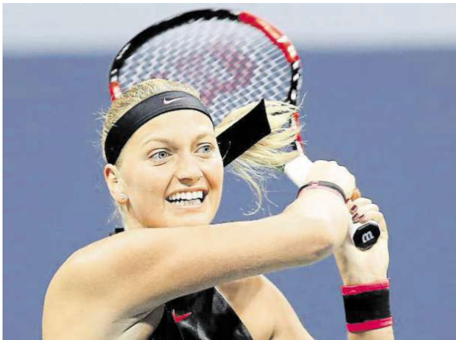
Víru ve vlastní síly ukázala Kvitová výhrou nad favorizovanou Španělkou Muguruzaovou.

Bývalá světová dvojka Kvitová hraje osmý turnaj po návratu na kurty po operaci všech pěti pořezaných prstů levé ruky z prosincového přepadení. Letos hrála už grandslamové French Open a Wimbledon a vždy vypadla ve 2. kole. „Hodně to pro mě zna-