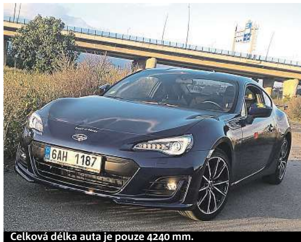
Celková délka auta je pouze 4240 mm.