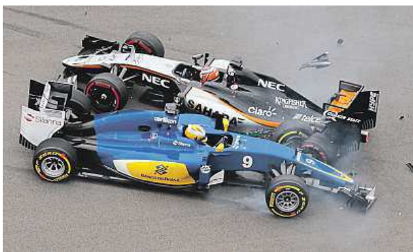
Kolize Nico Hülkenberga a Marcuse Ericssona

Hned po startu vjel Ericsson do Hülkenberga a na trať musel safety car. Po restartu závodu se jelo v klidu jen několik kol. Pak ale vinou technických problémů musel odstoupit vedoucí Rosberg a jeho naděje na celkové prvenství v sériálu prakticky zhasly. Brzy na to zcela zničil svůj vůz bez cizího zavinění Grosjean.