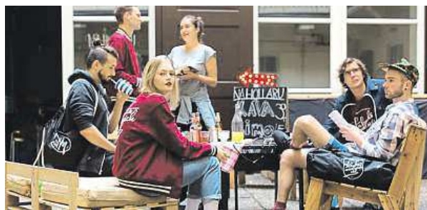
Studenti v novém oblečení od své školy