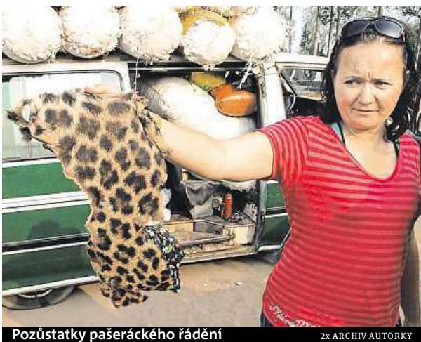
Pozůstatky pašeráckého řádění

Zažili jsme toho hodně. Nejkrásnější jako pro výcvikářku Camy pro mě bylo, když poprvé označila levhartí kůži a zbraň v kufru. Jeho majitel byl hned zatčen a bylo o pytláka méně. Zajímavý byl ale už samotný let. Cama je totiž hodně temperamentní. Myslela jsem si, že je v pořádku v přepravce v letadle a nehrozí žádný průšvih. Jenže Cama převrátila