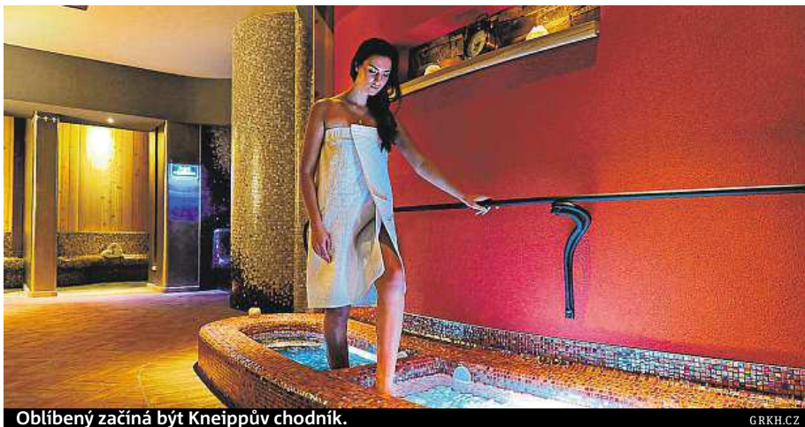
Oblíbený začíná být Kneippův chodník.

Odpočívat můžete v aromatické finské sauně, na rozžhavené lávové kameny se tu pra-