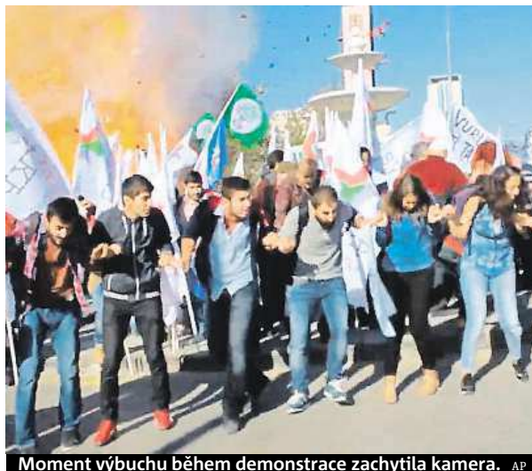
Moment výbuchu během demonstrace zachytila kamera.

Šlo o nejtragičtější podobné útoky, jaké kdy Turecko zažilo, uvedl zpravodajský server BBC News. V centru metropole si včera oběti připomínaly tisíce lidí, řada z nich přišla s protivládními transparenty. „Vrah Erdogan“ a „policejní vrazi“ zaznělo včera na náměstí, neboť se útok odehrál během opozičního shromáždění. Jeho účastníci tvrdí, že vláda na něm nese spoluvinu, když se dříve nevěnovala vyšetřování podobných útoků. Prezident Recep Tayyip Erdogan v prohlášení útok označil za „ohavný“, odsoudil jej a uvedl, že