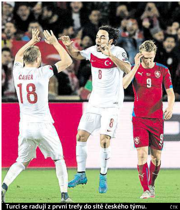
Turci se radují z první trefy do sítě českého týmu.