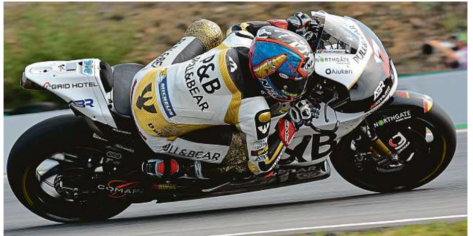
Osmadvacetiletý motocyklista se dohodl na přestupu do španělského týmu.

Tovární jezdci sice mezitím budou už zase jezdit na novějších strojích, přesto si Abraham výrazně polepší. Letos je totiž jedním z pouhých dvou jezdců, kteří ve startovním poli sedlají dva roky starou motorku. Příští sezonu už bude patřit mezi velký počet závodníků jezdících na rok staré motorce. Jeho budoucí týmový kolega, Španěl