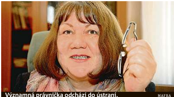
Významná právnička odchází do ústraní.

Ještě jako místopředsedkyně Ústavního soudu Wagnerová možnost opakování mandátu sama odmítala jako principiálně nevhodnou. Soudci by se podle ní mohli – byť třeba podvědomě – podbí-