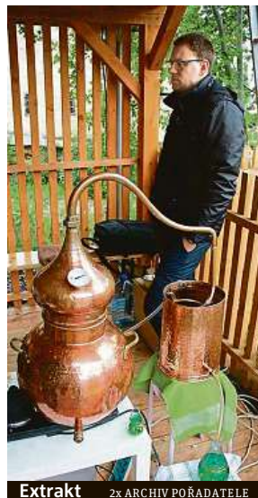
Extrakt 2x ARCHIV POŘADATELE

a stánkem s bylinkovou kombuchou – lehce perlivým čajovým nápojem. V dětském koutku zase najdou zábavu ti nejmenší a rovnou si zde zku-