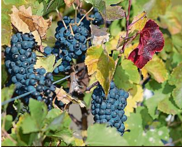
Loni byla úroda vína slabší.

Cenu za zahraniční kolekci vín získalo vinařství Hope Estate z Austrálie. Byla také udělena mimořádná cena za dvacetiletou účast v soutěži a trvale vynikající výsledky, a to Znovínu Znojmo. „Letos bylo přihlášeno 603 vzorků