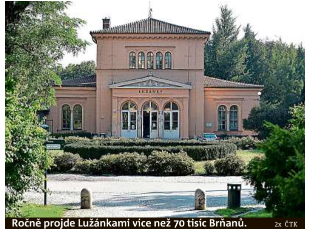
Ročně projde Lužánkami více než 70 tisíc Brňanů.

spolupracovat magistrát. Změstnanci Lužánek navrhnou projekty, které zlepší využití volného času širší veřejnosti v Brně a zvelebí veřejný prostor. Hlasovat budou moci účastníci Hry po Brně, nejúspěšnější projekt se poté zrealizuje.