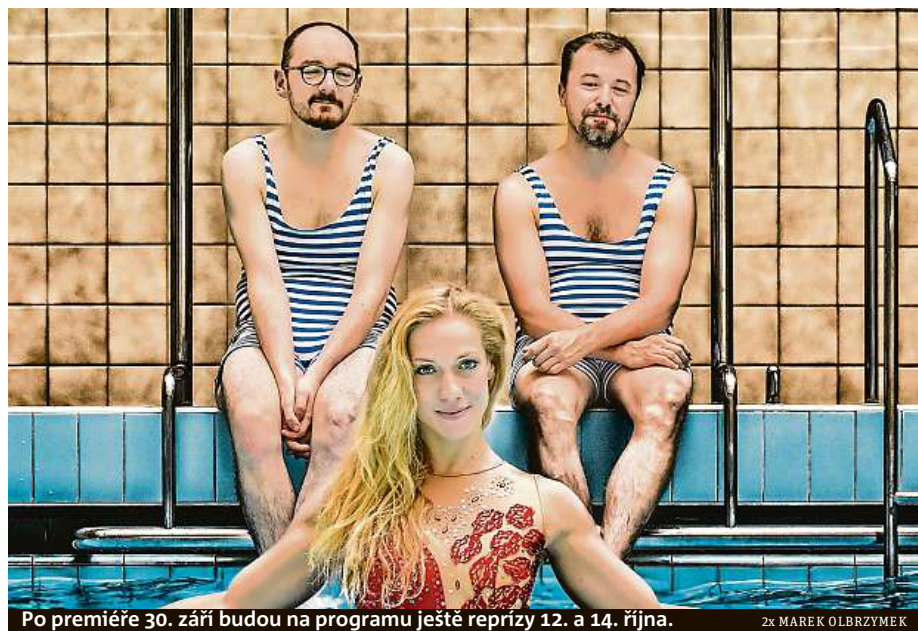
Po premiéře 30. září budou na programu ještě reprízy 12. a 14. října.

Škarka. Po premiéře 30. září budou na programu ještě reprízy 12. a 14. října. Vstupenky na přibližně půlhodinové představení stojí 100 korun a jsou v prodeji v síti SMS Ticket. RADEK BABIČKA