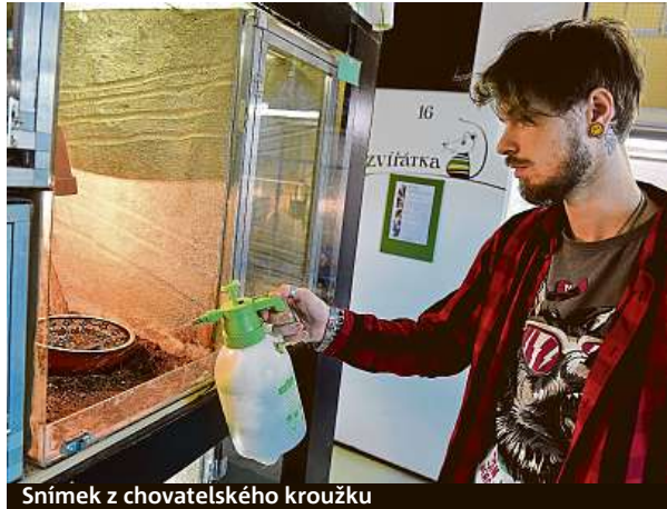
Snímek z chovatelského kroužku

Výstava fotografií s názvem Tehdy a teď porovná, jak vypadaly Lužánky v minulosti a jak vypadají dnes. Fotografie budou zdobit brněnské tramvaje. S pomocí aplikace Hra po Brně, kterou za-