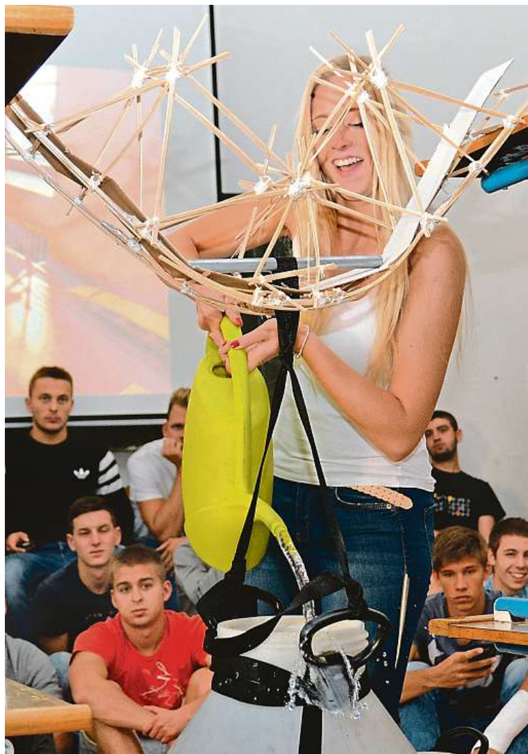
Žáci SPŠ stavební v Brně při tradiční soutěži ve stavění mostů ze špejli 2x BAB