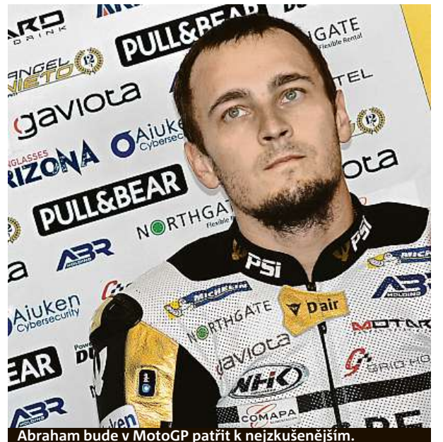
Abraham bude v MotoGP patřit k nejzkušenějším.

Sezona 2019 bude již osmou, ve které jezdec, jemuž přezdívali Abaja, nastoupí v kategorii MotoGP. Z tohoto pohledu bude patřit mezi sedmičku nejzkušenějších jezdců seriálu. RADEK BABIČKA