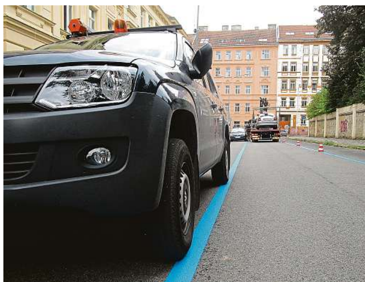
Při malování modrých čar označujících rezidentní parkování