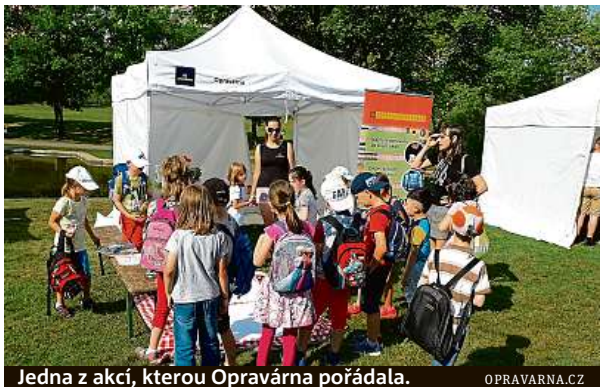
Jedna z akcí, kterou Opravárna pořádala.

Za projektem stojí společnost Opravárna, aktuálně největší síť drobných opraváren a odborných servisů v Česku. „Začali jsme s webem, který jednoduše spojuje zákazníky s opraváři. Díky němu jsme dnes schopni najít opraváře na cokoli opravitelného. Jen-