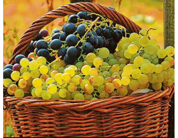
Hrozny vína z jihu Moravy

od 123 vinařů, což ve srovnání s loňským rokem představuje pokles asi o deset procent. Loňský rok byl co do množství vína podprůměrný. Počet přihlášených vzorků proto klesl ve všech soutě- žích, někdy až o padesát procent,“ uvedl pořadatel soutěže Dan Mádr.