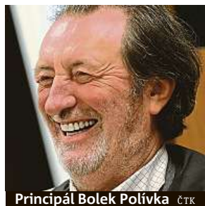
Principál Bolek Polívka

Repertoár brněnského Divadla Bolka Polívky se v nadcházející sezoně rozšíří o tři inscenace včetně principálových autorských novinek. Má pracov-