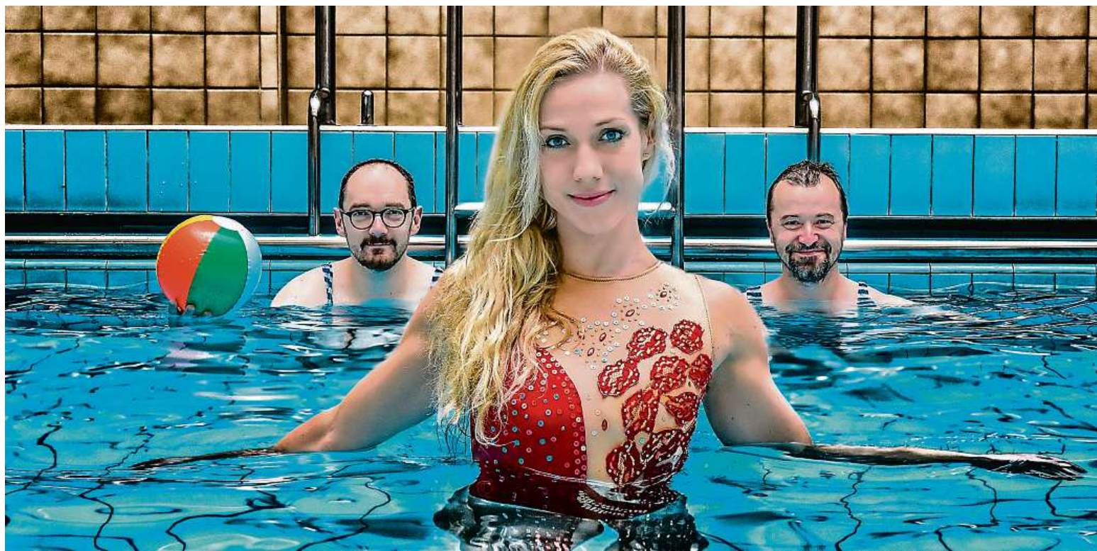
Hausopera se zároveň hlásí k tradici progresivní dramaturgie Janáčkovy opery.

Užijte si neobyčejnou operu v bazénu, místo obleku si připravte žabky.