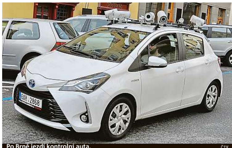
Po Brně jezdí kontrolní auta.

Kovolit, a. s., Nádražní 344, 664 42 Modřice, tel.: +420 532 157 111, www.kovolit.cz