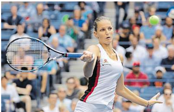
Z New Yorku zamíří Karolína Plíšková na pár dnů domů.

Lucie Šafářová s Američankou Bethanií Mattekovou-Sandsovou vyhrály na US Open čtyřhru. Dvanácté nasažené hráčky porazily ve včerejším finále v New Yorku francouzské turnajové jedničky Caroline Garciaovou a Kristinu Mladenovicovou 2:6, 7:6, 6:4 a získaly třetí společný grandslamový titul. Šafářové se s Mattekovou-Sandsovou letos zpočátku kvůli zdravotním problémům nedařilo, ale v New Yorku odehrály skvělý turnaj. Po loňských triumfech na Australian Open a French Open tak mají třetí velký turnajový vavřín.