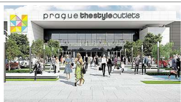
Kam v metropoli za levným zbožím

Ted' to vypadá, že se projekt opět rozjel. Objekt koupil španělský developer, společnost Neinver. „Vzhled interiéru vychází z tradiční pražské architektury Starého Města. Poskytne neobyčejný zážitek outletového nakupování v duchu slavných pražských nákupních tříd s prémiovými značkami pod jednou stře-