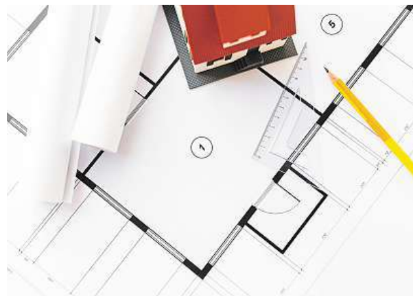
Při plánování nezapomeňte na rozpočet.

Strach není potřeba mít ani z toho, že se jednou v životě něco zvrtné a dojdou prostředky na splácení. S Flexibilní hypotékou si můžete snížit splátku až na polovinu nebo splácení až na tři měsíce přerušit úplně.