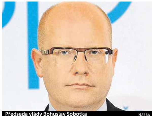
Předseda vlády Bohuslav Sobotka

V Praze je to vždycky o osobnostech, to spektrum je široké, voliči si mohou vybrat. Chtěli jsme nabídnout kandidáty, které může volit jak levice, tak ti, kteří volí liberální střed.