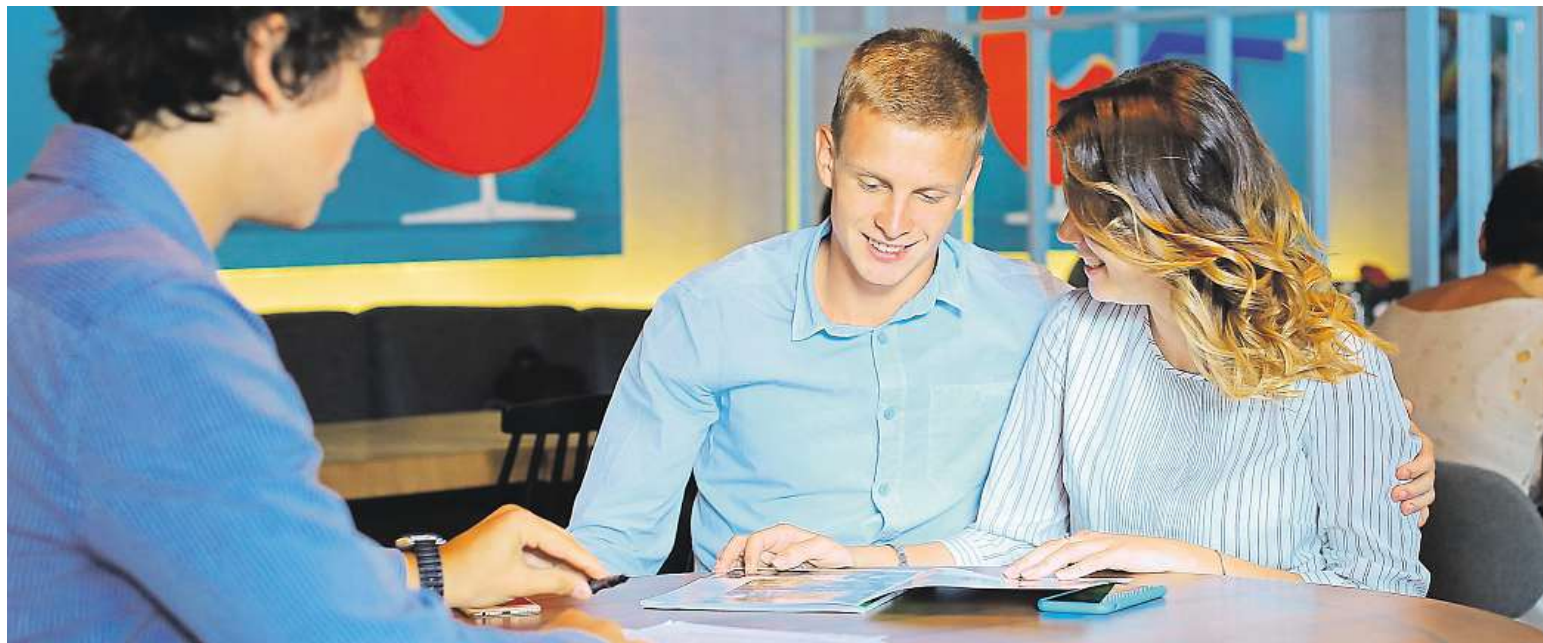
Výstavba nového rodinného domu nebo nákup bytu obvykle představují největší životní investici.