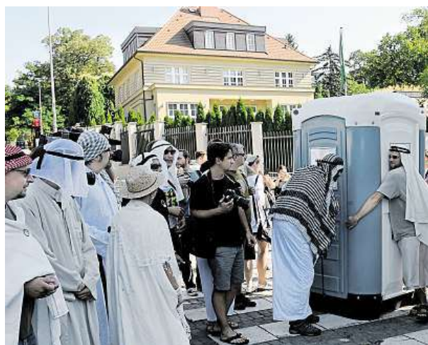
Parodie na muslimský svátek se s pochopením úředníků a policie nesetkala.