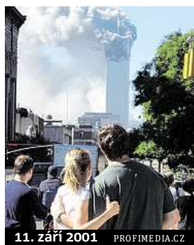
11. září 2001

Vůbec první konspirační teorii, která se po útoky objevila, byla ta, že za útokem stála izraelská zpravodajská služba Mosad. Tvrdilo se, že 11. září nepřišlo mnoho Židů do Světového obchodního centra do práce. Izraelci měli chtít USA vyprovokovat k tomu, aby zaútočily na arabské země.