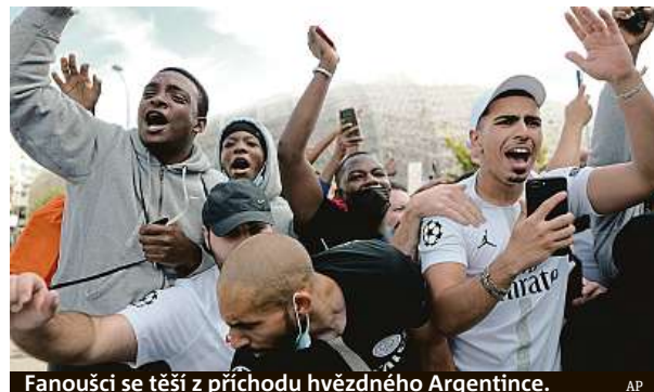
Fanouři se těší z příchodu hvězdného Argentince.

„Byla to ohromná změna. Všechno, co se stalo minulý týden, bylo opravdu náročné, rychlé a emotivní. Stále nemohu uvěřit tomu, co jsem