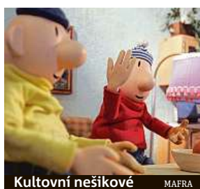
Kulturní nešikovné MAERA

začal točit v roce 1979 a do poloviny 80. let vzniklo ve studiu Krátkého filmu Praha 28 dílů. Po roce 1990 založil Lubomír Beneš své vlastní studio animovaného filmu, kde vznikly další díly. Po jeho smrti v roce 1995 pokračovaly další díly s jinými tvůrci, na mnohých z nich se podílel Benešův syn Marek. ČTK