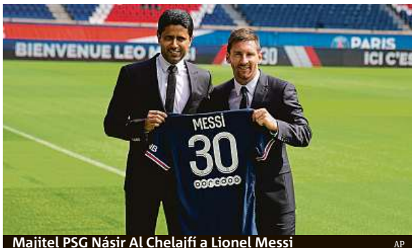
Majitel PSG Násir Al Chelajfí a Lionel Messi

„Jsem rád, že tu můžu být. Klub je nastavený na to, aby vyhrával trofeje, a to je i můj cíl. Chci pořád růst, zlepšovat se a vítězit. Věřím, že se nám to spolu podaří a naplníme všechny klubové cíle,“ pro-