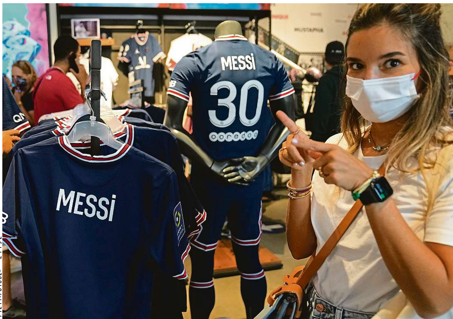
Hvězdný fotbalista Lionel Messi svým přestupem do Paris Saint-Germain pobléžnil fanoušky. Jeho dresy jdou na dračku. Více na straně 7

Energie. Obava ze zdražování kvůli epidemii covidu i zelené vlně je namístě. Dodavatelé. Boj o zákazníky sílí, lidé se rozhodují také na základě referencí. Solární panely. Nabídka státních dotací je stále širší STRANA 4