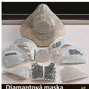
Diamantová maska

„Šperk z osmnáctikarátového zlata bude osazen asi 3600 diamanty,“ řekla spolu-