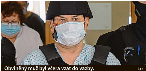
Obviněný muž byl včera vzat do vazby.

Spor muž řešil benzínem a zapalovačem ve chvíli, kdy se v bytě konala dětská oslava.