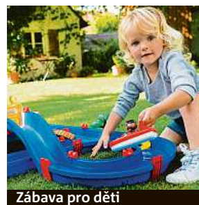
Zábava pro děti

i uprostřed obývacího pokoje. Středobodem zábavy pak bude mohutná skála, která na svém vrcholu nabízí zmiňované jezero, ze kterého vede skluzavka, a jeskyně v úpatí, kde se bude moct přiložená trojice zvířecích figurek schovat před pražením poledního slunce a posvačit. Do horního jezera se zvířátka vydají zdymadlovým systé-