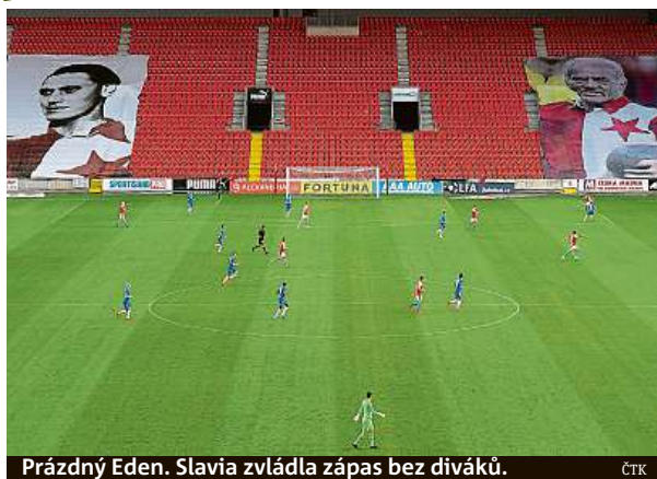
Prázdný Eden. Slavia zvládla zápas bez diváků.

Baník na svém hřišti vyhrál 4:2 nad dalším pražským týmem, Bohemians 1905. Ostřavští doma naplno bodovali po sérii pěti zápasů, ve kterých uhráli jediný bod. Baník porazil klokany v pátém soustředěném utkání v řadě. Bohemians ani potřeby v novém ročníku venku nebodovali. Karviná zachránila remízu 1:1 v Olomouci a získala druhý bod v sezoně, zůstala však