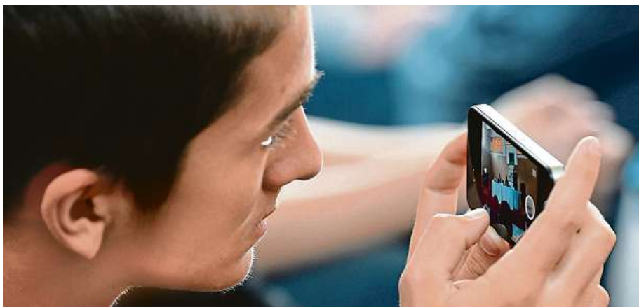
Světlo vyzařující z mobilů má na svědomí i nespavost.