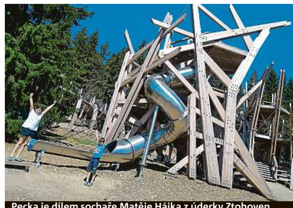
Pecka je dílem sochaře Matěje Hájka z úderky Ztohoven.

magické místo, kterému se říká herní krajina Pecka. Na louce a mezi stromy byly vybudovány interaktivní obří dřevěné sochy a objekty inspirované krkonošskou faunou. Narazíte zde na rysa, jelena, zmije, mloka nebo můžete přejít po lanové stezce mezi čapími hnízdy. Nezapomeňte si koupit dřevěnou kuličku – některé prvky fungují jako dráha! HOP