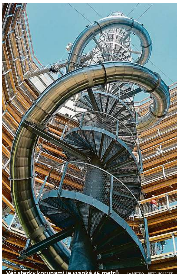
Věž stezky korunami je vysoká 45 metrů.

Tady se stanete součástí lesa. Na krkonošské stezce korunami stromů se budete cítit jako ve vrtulníku i jako na horské dráze.