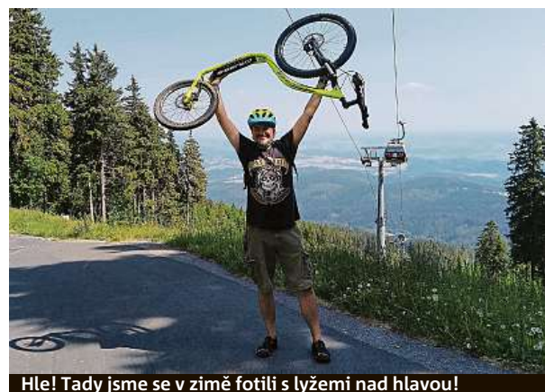
Hle! Tady jsme se v zimě fotili s lyžemi nad hlavou!

Koloběžka na jednu jízdu i se vstupenkou na kabinku stojí 450 korun. Helma je součástí balíčku. HOP