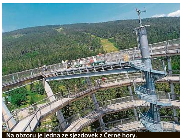
Na obzoru je jedna ze sjezdovek z Černé hory.