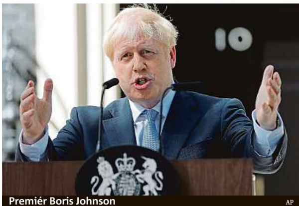
Premiér Boris Johnson

Irská pojistka má zabránit hraničním kontrolám mezi Irskou republikou a britským Severním Irskem po odchodu Spojeného království z EU.