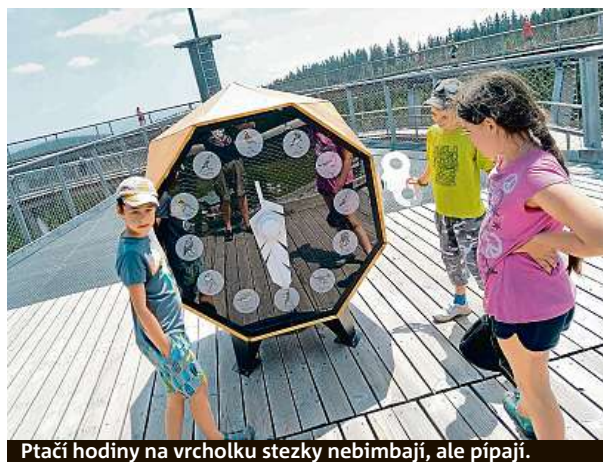
Ptačí hodiny na vrcholku stezky nebimbají, ale pipají.