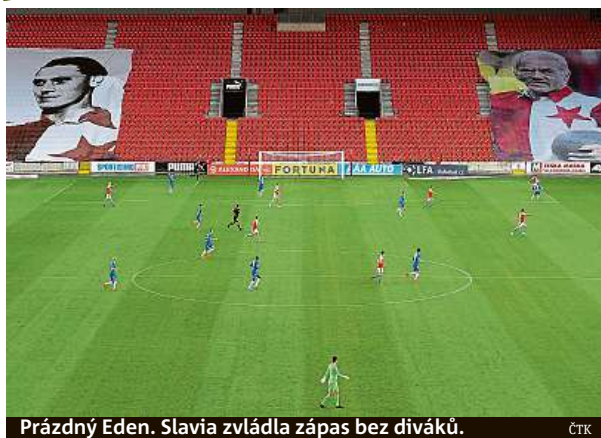
Prázdný Eden. Slavia zvládla zápas bez diváků.

Baník na svém hřišti vyhrál 4:2 nad dalším pražským týmem, Bohemians 1905. Ostřavští doma naplno bodovali po sérii pěti zápasů, ve kterých uhráli jediný bod. Baník porazil klokany v pátém soustředěném utkání v řadě. Bohemians ani potřeby v novém ročníku venku nebodovali. Karviná zachránila remízu 1:1 v Olomouci a získala druhý bod v sezoně, zůstala však