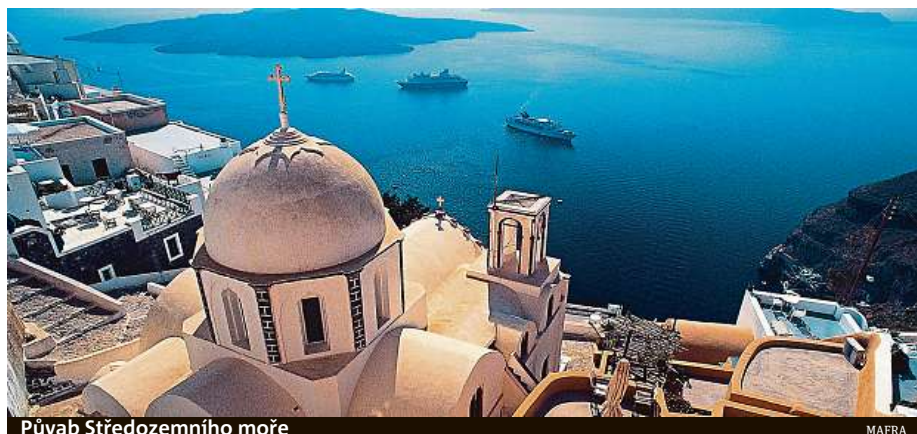
Půvab Středomořího moře

Na prvních dvou místech evropského srovnání kvality vody se umístily Kypr a Malta, kde měly výbornou čistotu téměř všechny lokality (99,1 a 98,9 procenta). Mezi oblíbenými přímořskými destinacemi Čechů se daří také Řecku. Výbornou kvali-