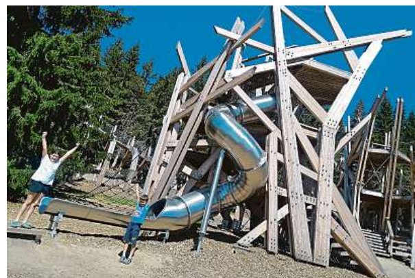
Pecka je dílem sochaře Matěje Hájků z úderky Ztohoven.

magické místo, kterému se říká herní krajina Pecka. Na louce a mezi stromy byly vybudovány interaktivní obří dřevěné sochy a objekty inspirované krkonošskou faunou. Narazíte zde na rysa, jelena, zmije, mloka nebo můžete přejít po lanové stezce mezi čapími hnízdy. Nezapomeňte si koupit dřevěnou kuličku – některé prvky fungují jako dráha! HOP