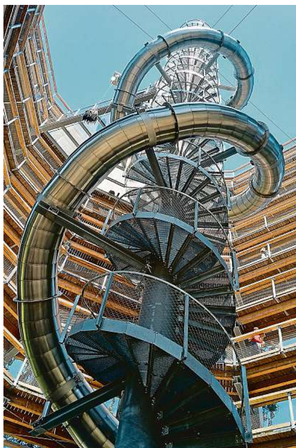
Věž stezky korunami je vysoká 45 metrů.

Tady se stanete součástí lesa. Na krkonošské stezce korunami stromů se budete cítit jako ve vrtulníku i jako na horské dráze.