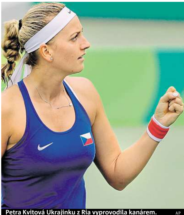
Petra Kvitová Ukrajinu z Ria vyprovodila kanárem.

Poslední česká zástupkyně ve dvouhře ve čtvrtfinále za 49 minut smetla 6:2 a 6:0 Ukrajinu Jelinu Svitolinovou, která v předchozím kole senzačně vyřadila světovou jedničku Serenu Williamsovou. O finále si Kvitová zahraje s Portoričankou Monikou Puigovou. Jedenáctá nasazená Kvitová dnešním vítězstvím překonala své dosavadní olympijské maximum, jímž bylo čtvrtfinále z minulých her v Londýně. Jistotu minimálně jedné medaile už máme v dámské čtyřhře. Do semifinále, v němž nebudou hrát proti sobě, se dostaly Lucie Šafářová s Barborou Strýcovou i Andrea Hlaváčková s Lucíí Hradeckou. SM