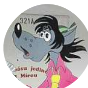
Alexandr Lazarov Ano, chytají venku pokémony.

Komiks HEZKÉ PRAŽDINY! Pokladnu opět otevíráme 22. 8. ve 13.00, hrajeme 17. 9. ve 14.00.