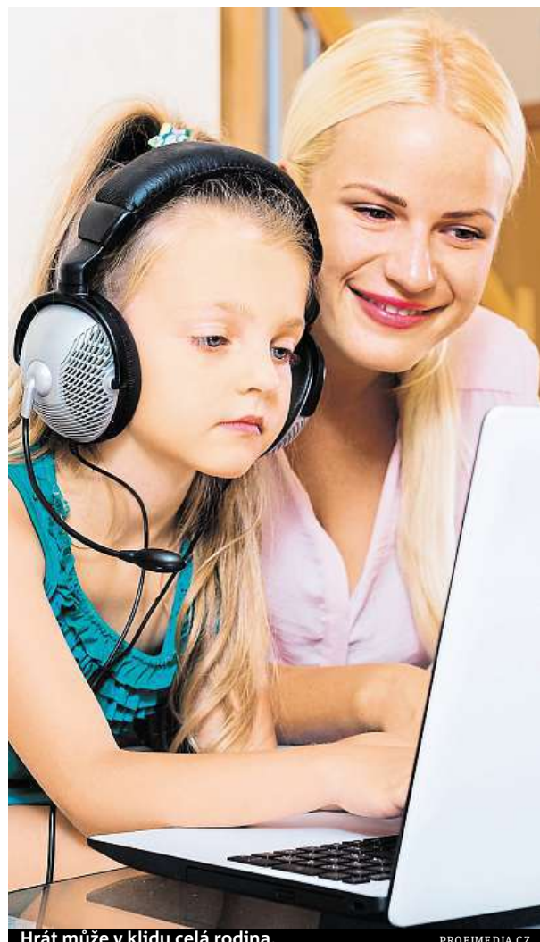
Hrát může v klidu celá rodina.