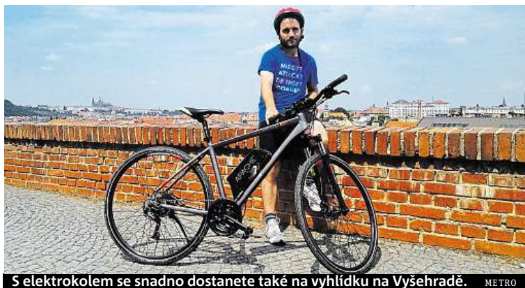
S elektrokolem se snadno dostanete také na vyhlídku na Vyšehradě. METRO

Stačilo párkrát šlápnout a hned jsem měl pocit, že mi narostla křídla. V kopcích jsem nefuněl a celkově dojel dál.