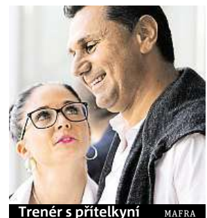
Trenér s přítelkyní MAFRA