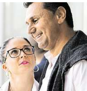
Trenér s přítelkyní