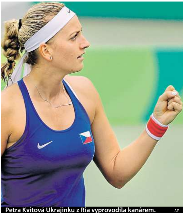
Petra Kvitová Ukrajinu z Ria vyprovodila kanárem.

O medaile budou hrát i Lucie Šafářová a Barbora Strýcová, jež otočily čtvrtfinále s nasazenými Italkami Robertou Vinciiovou a Sarou Erraniovou. Po více než dvou hodinách vyhrály 4:6, 6:4, 6:4. SM