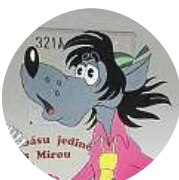
Alexandr Lazarov Ano, chytají venku pokémony.

Komiks HEZKÉ PRAŽDINY! Pokladnu opět otevíráme 22. 8. ve 13.00, hrajeme 17. 9. ve 14.00.