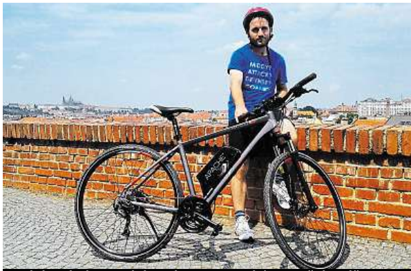
S elektrokolem se lehce dostanete také na Vyšehrad. METRO

Takový výšlap Modřanskou roklí dá normálně zabrat, ale s elektrokolem se vyvezete celkem v pohodě.