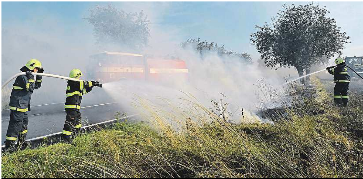
Minulý týden hasiči likvidovali požár deseti hektarů pole u Malého Boru na Klatovsku v části Týnec. Zasahovalo 30 mužů.

Ve dvanácti případech se na likvidaci požáru podílelo přes deset jednotek hasičů.