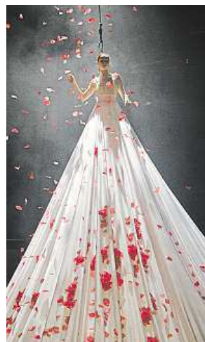
Představení Bianco LL

Nabídka platí do vyprodání zásob. Odběr možný jen v obvyklém množství (tj. max. 5 ks na osobu a den, trvanlivé mléko max. 12 ks na osobu a den, lahvevé pivo max. 20 ks na osobu a den, není-li uvedeno jinak). Tento dokument není nabídkou (návrhem na uzavření smlouvy) ani výzvou k podání nabídek. Jde o dokument určený pouze k marketingovým a propagačním účelům. Vzhledem k faktu, že společnost Penny Market s.r.o. pravidelně provádí kontrolu na přítomnost reziduí používaných chemických látek při pěstování ovoce a zeleniny, sledává občanské sdružení Zdravá potravina, z.s. tyto produkty jako nezávadné.