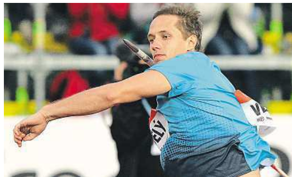
Vítězslav Veselý obhájuje evropský titul.

V Curychu startuje atletické mistrovství Evropy. Z toho posledního přivezli Češi pět medailí.