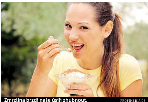
Zmrzlina brzdí naše úsilí zhubnout.

Jedním z důvodů může být to, že večer jíme pozdě. A ještě si ugrilujeme kus šťavnatého masa s horou dalšího jídla. Tělo si s takovým přívalem kalorií ale už v pozdních hodinách nedokáže poradit a spotřebovat ho. „Pravidelná strava, vždy po třech hodinách a poslední jídlo dvě až tři ho-