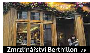
Zmrzlinářství Berthillon