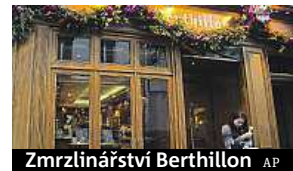
Zmrzlinářství Berthillon