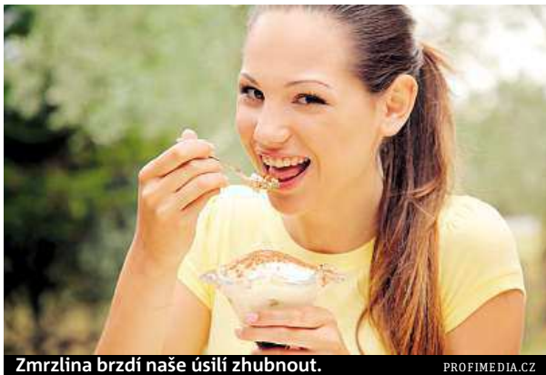
Zmrzlina brzdí naše úsilí zhubnout.

Jedním z důvodů může být to, že večer jíme pozdě. A ještě si ugrilujeme kus šťavnatého masa s horou dalšího jídla. Tělo si s takovým přívalem kalorií ale už v pozdních hodinách nedokáže poradit a spotřebovat ho. „Pravidelná strava, vždy po třech hodinách a poslední jídlo dvě až tři ho-