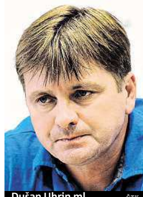
Dušan Uhrin ml.

Vyřazení Viktorie z Evropské ligy je důvodem odvolání hlavního kouče. Jméno jeho nástupce zatím známo není.