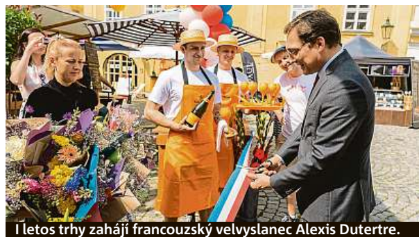
I letos trhy zahájí francouzský velvyslanec Alexis Dutertre.

lie and the Chocolate. V sobotu posluchače oblaží klasickým repertoárem Klárovo kvarteto. Pro děti bude doprovodný program probíhat od středy do soboty. MET