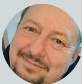
Jaroslav Paulík Muchomůrka růžovka. Nejlepší je nadívaná masem.