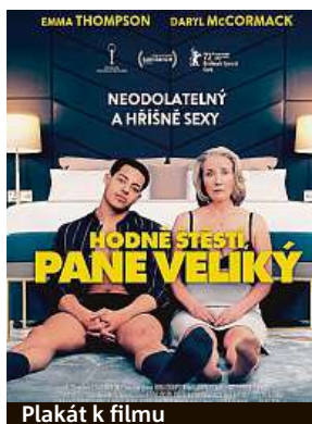
Plakát k filmu

Za celý svůj život spala jen s vlastním mužem, který navíc v posteli nestál za nic. Když zůstane sama, uvědomí si, že vlastně vůbec netuší, co je dobrý sex, nikdy v životě nezažila orgasmus.