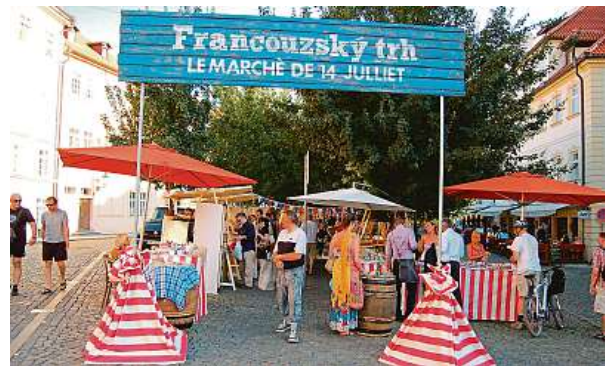
Festival láká milovníky chuťových zážitků.

Nouze nebude ani o zábavu. Příjemnou atmosféru ke gurmánským zážitkům dokreslí hudební vystoupení.