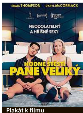
Plakát k filmu

Za celý svůj život spala jen s vlastním mužem, který navíc v posteli nestál za nic. Když zůstane sama, uvědomí si, že vlastně vůbec netuší, co je dobrý sex, nikdy v životě nezažila orgasmus.