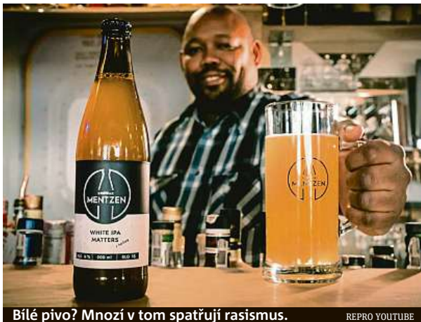
Bílé pivo? Mnozí v tom spatřují rasismus.

Reklama, kterou vydal pivovar Mentzen, ukazuje pracujícího černošského číšníka obklopeného nespočtem předmětů z amerického jihu, včetně praporu Konfederace často považovaného za symbol otrokářství. Pivovar vlastní politik Sławomir Mentzen