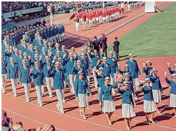
Nástup československých sportovců v Tokiu v roce 1964