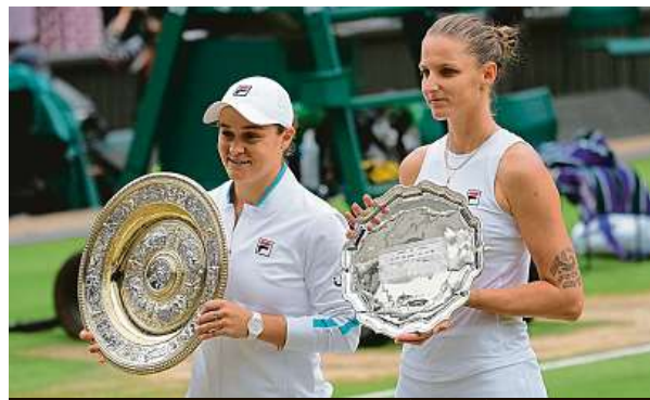
Ashleigh Bartyová a Karolína Plíšková (vpravo) s trofejemi

Tenistka Karolína Plíšková vidí i na prohře ve finále Wimbledonu pozitivita.