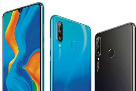
Prázdninová akce s Huawei

Rozbití displeje je noční můrou zejména pro majitele nových mobilních telefonů z vyšší cenové kategorie. Pokud si ale mezi 10. a 31. červencem pořídíte některý model Huawei z rodiny P30, obavy můžete hodit za hlavu. Po registraci telefonu v aplikaci HiCare totiž získáte po následujících dvanácti měsících nárok na jednu výměnu displeje zcela zdarma.