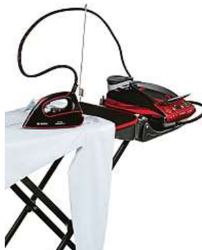
Není prkno jako prkno.

Ukazuje se, že prostor pro inovace se v oblasti elektroniky najde doslova všude. Dokonce i v léty prověřených a neměnných činnostech. Například v žehlení, které bez pochyby patří mezi časově nejnáročnější domácí práce. Jak jej tedy usnadnit? Technologické inovace žehliček jsou samozřejmě to první, co každého napadne. A výrobci elektroniky se v této oblasti nálezitě činí. Neméně důležitá je ale plocha, na které žehlení probíhá. I té si už výrobci elektroniky všimli.