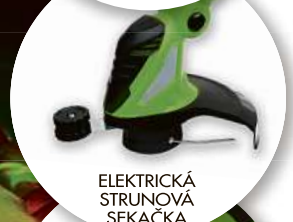
ELEKTRICKÁ STRUNOVÁ SEKAČKA