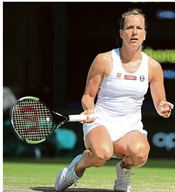
Třetí grandslam sezony bude bez české finalistky.

Druhý set rozehrála Strýcová uvolněněji a několikrát si vysloužila potlesk zaplněného hlediště centrálního dvorce. Serena však byla pevná na servisu, Češka při něm ve druhém dějství získala jen čtyři