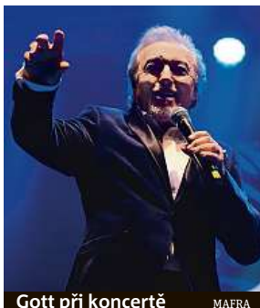
Gott při koncertě

Rodák z Plzně chtěl být v mládí malířem, k této zálibě se později vrátil. Už při studiích na elektromontéra se ale věnoval zpěvu a hudbě.