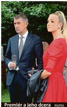
Premiér a jeho dcera

Ještě před včerejším jednáním Zemana s Babišem se na velvyslanectví Francouzské republiky v Praze konaly oslavy státního svátku této jihoevropské země. Premiéra na slavnost doprovodila dcera Vi-