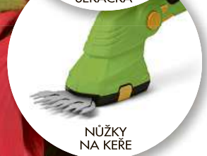
NŮŽKY NA KŘE