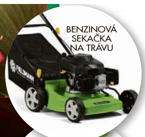
BENZINOVÁ SEKAČKA NA TRÁVU

SOUTĚŽ PROBÍHÁ DO 14. 8. 2019 NA WWW.IDNES.CZ/NEJKRASNEJSIZAHRAĐA