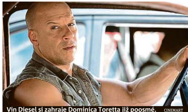
Vin Diesel si zahraje Dominica Toretta již poosmé.

Začátkem srpna spojí v kinech síly Johnson se Stathamem. I kvůli tomu si nenajdou čas na klasickou devítku Rychle a zběsile.