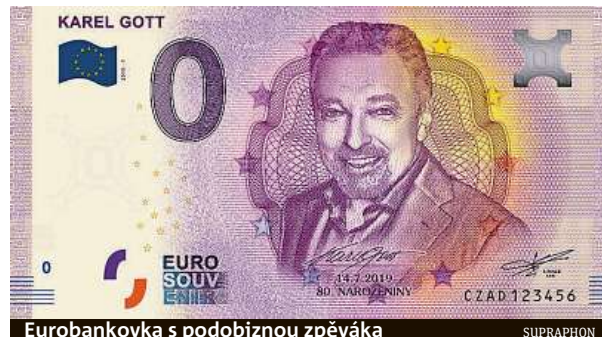
Eurobankovka s podobiznou zpěváka

V roce 1990 ukončil Gott kariéru, ale obrovský úspěch rozlučkového turné ho donutil rozhodnutí přehodnotit. V roce 2008 si vzal za ženu Ivanu, s níž má dvě dcery. Dal-