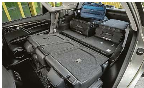
Ložná plocha nákladního prostoru může mít délku 1067 mm.