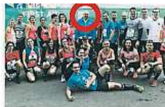
Pradecká starosta měla osm týdnů z Prahy 1.