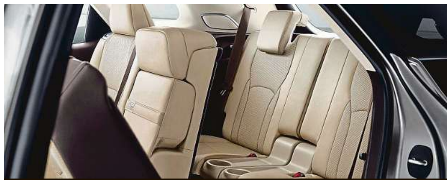
Na designu interiéru se podíleli odborníci z Yamahy.