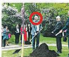
Ve Vrchlického sadech pěstují Strom svobody.