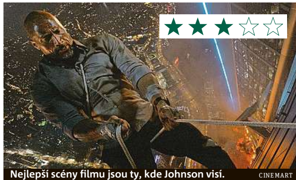
Nejlepší scény filmu jsou ty, kde Johnson visí.

Film Mrakodrap vykazuje typické znaky akčního běčka.