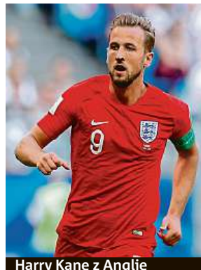
Harry Kane z Anglie