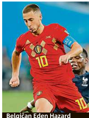
Belgičan Eden Hazard