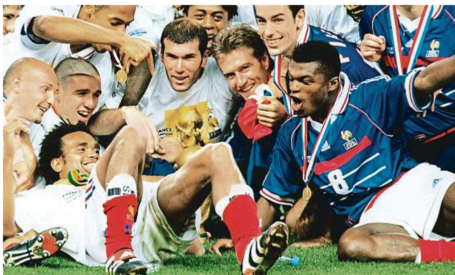
Po finále v roce 1998 slavil i dnešní trenér Francie Deschamps (blodák uprostřed).

Země galského kohouta je v transu. Fotbaloví fanoušci věří v opakování dvacet let starého triumfu na domácím mistrovství.