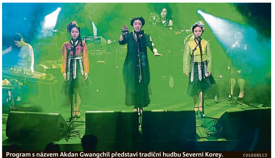
Program s názvem Akdan Gwangchil představí tradiční hudbu Severní Korey.

Celkově se mohou návštěvníci těšit na více než 350 programových bodů na 21 scénách. Z toho přes 130 kapel a hudebníků mnoha žánrů – od elektroniky přes world music, rock, pop, soul až po jazz – a z celého světa – od Austrálie a Nového Zélandu přes Jižní Koreu, Čínu, Írán, Kolumbiu, Kubu, Jamajku, Tunisko, Pobřeží slonoviny, Mosambik až po Island, USA, Velkou Británii nebo Kanadu.