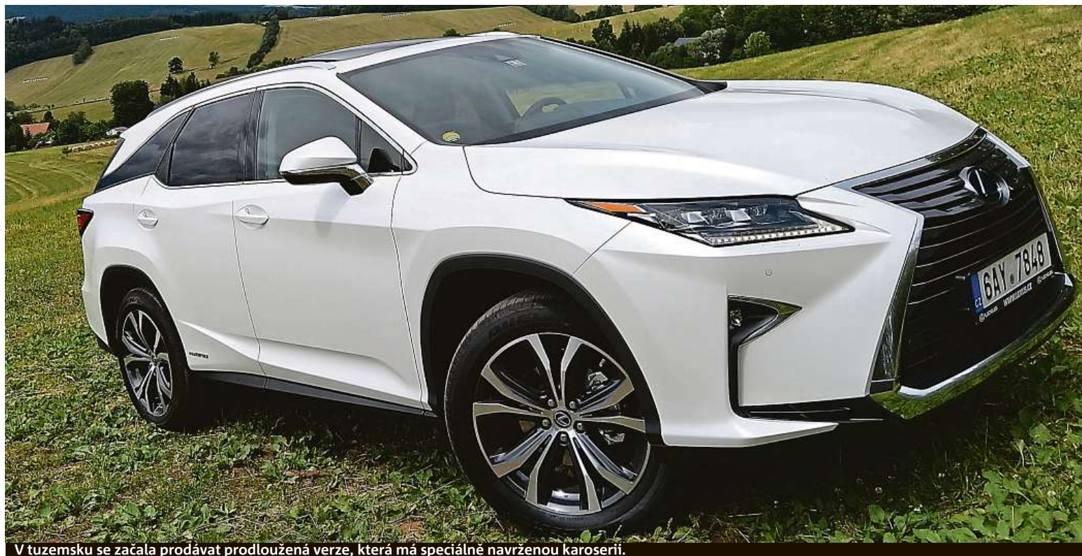
V tuzemsku se začala prodávat prodloužená verze, která má speciálně navrženou karoserii.

Jako jedna z prvních redakcí jsme otestovali prodloužený Lexus RX L.