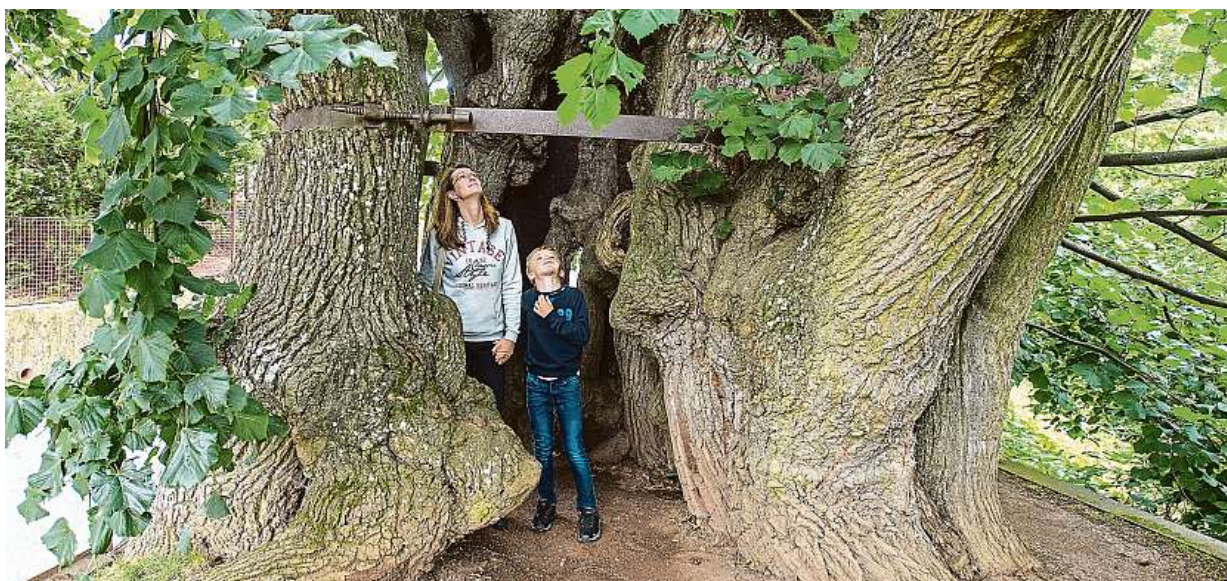
Vítězem krajského kola soutěže Vesnice roku 2018 se v Libereckém kraji staly Tatobity. Na snímku místní stará lípa.

Muchovo dílo. Na soubor obrazů nyní lákají hned dvě města. Časté stěhování. Plátna nepoškozuje, podle odborníků s ním autor počítal. Moravský Krumlov. Na zámek dnes jezdí už jen zlomek turistů STRANA 5