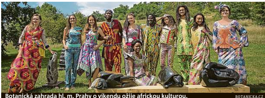
Botanická zahrada hl. m. Prahy o víkendu ožije africkou kulturou.

Nejen vaše chuťové buňky si během víkendu 14. a 15. července přijdou na své. Návštěv-