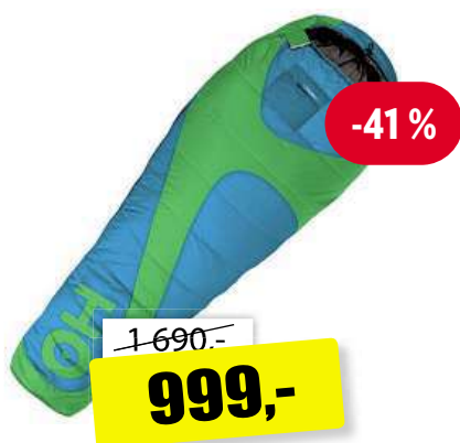
Husky Mantilla -5°C spací pytel - mumie