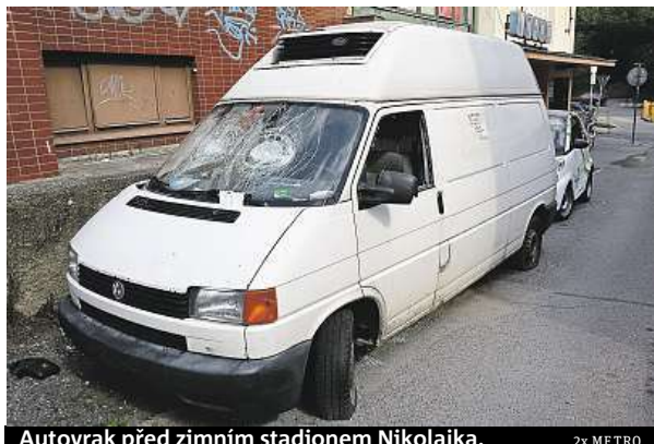
Autovrak před zimním stadionem Nikolajka.