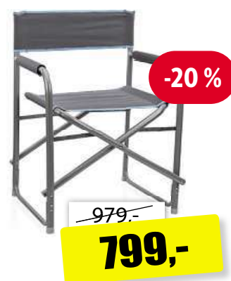
Tristar Florence kempingové křeslo