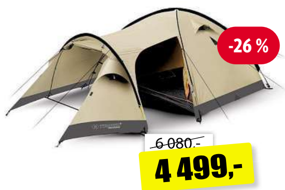
Stan Trimm Camp II sand pro 4-5 osob, váha 7,2 kg