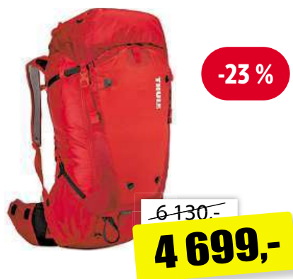
Batoň Thule Versant 60L Bing bederní pás, kapsa VersaClick