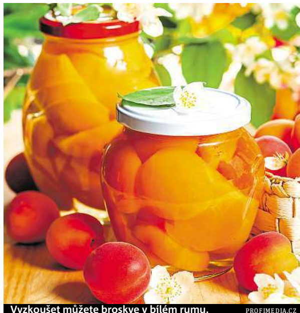
Vyzkoušet můžete broskve v bílém rumu.

1. Květák rozebereme na menší růžičky a omyjeme.