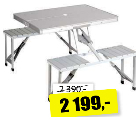
Tristar TA-0820 skládací stůl, rozměry: 136 × 86,5 × 67,5 cm