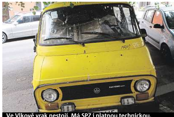
Ve Vlkově vrak nestojí. Má SPZ i platnou technickou.

vzhledem, ale i tím, že si je kdosi plete s ubytovnou.