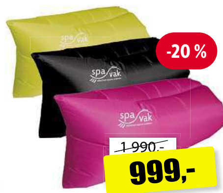
Spavak Eljet nafukovací vak