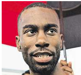
DeRay McKesson

Protesty vyvolaly dva policejní zákroky v Minnesotě a Louisianě, při nichž byli minulý týden zabiti dva černoši.