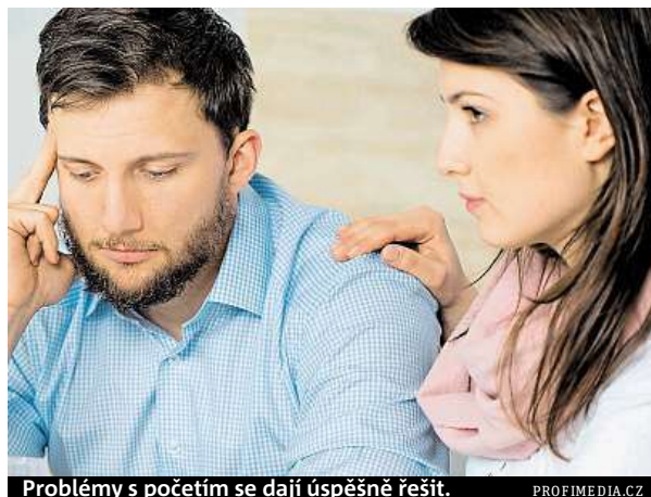
Problémy s početím se dají úspěšně řešit.

K nejistotě mužů se navíc přidává i malá informovanost o metodách vyšetření, které je čekají, rozhodnou-li se od-