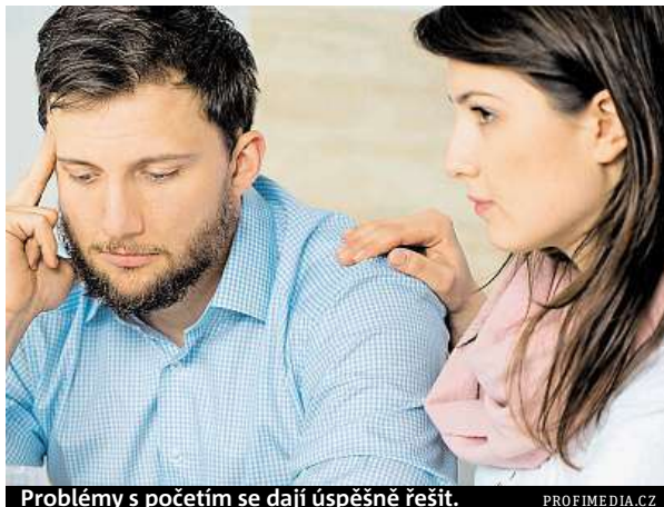
Problémy s početím se dají úspěšně řešit.

K nejistotě mužů se navíc přidává i malá informovanost o metodách vyšetření, které je čekají, rozhodnou-li se od-