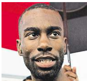
DeRay McKesson

Protesty vyvolaly dva policejní zákroky v Minnesotě a Louisianě, při nichž byli minulý týden zabiti dva černoši.