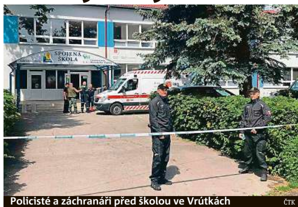
Policisté a záchranáři před školou ve Vrútkách