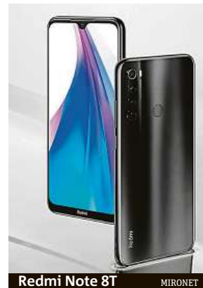
Redmi Note 8T MIRONET

A na kolik vás Xiaomi Redmi Note 8T přijde? Věřte nevěřte, v internetovém obchodě Mironet se prodává již od 4756 korun. Za tuto cenu dostanete skvěle vybavený telefon, který vám dlouho vydrží dělat radost.