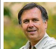
Petr Hamerník Zoo Praha