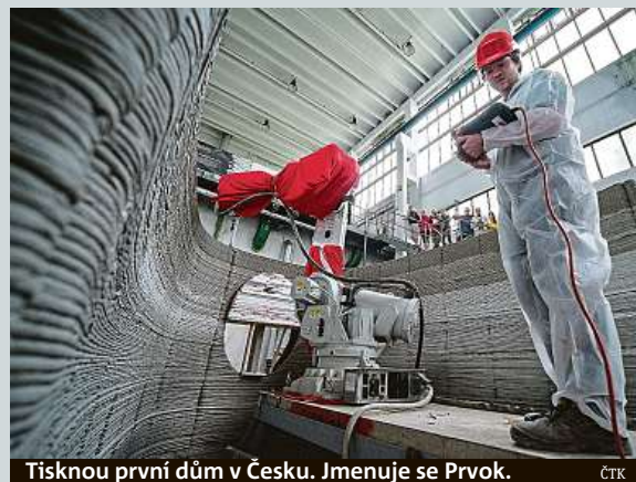
Tisknou první dům v Česku. Jmenuje se Prvok.