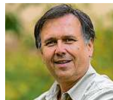
Petr Hamerník Zoo Praha