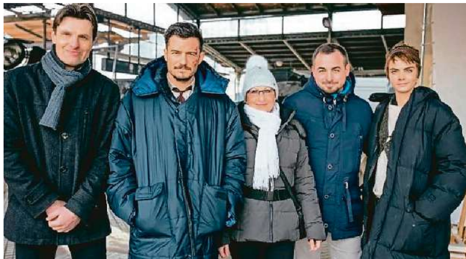
V létě do ČR přijede Orlando Bloom (druhý zleva) i Cara Delevigne (zcela vpravo).

Podle informací zveřejněných českou Asociací producentů v audiovizí se v tuzemsku kvůli koronaviru stoplo