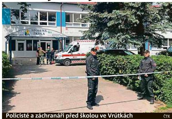
Policisté a záchranáři před školou ve Vrútkách