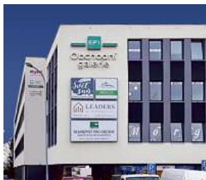
Obchodní galerie, Jihlava