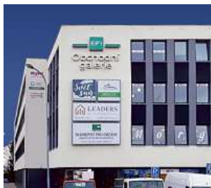
Obchodní galerie, Jihlava