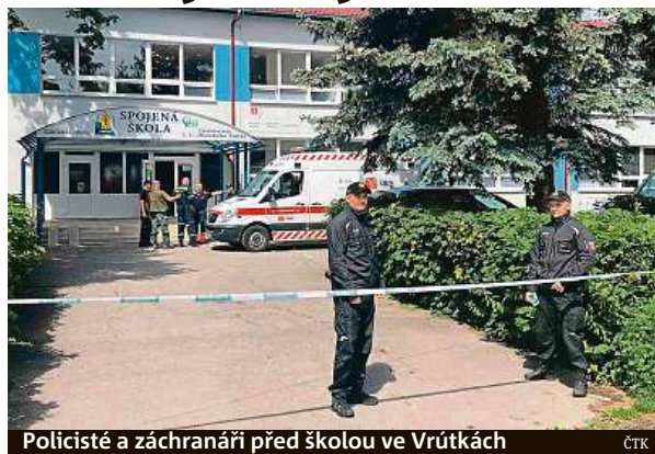
Policisté a záchranáři před školou ve Vrútkách