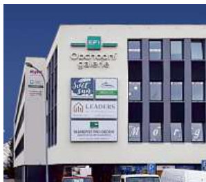
Obchodní galerie, Jihlava