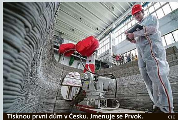
Tisknou první dům v Česku. Jmenuje se Prvok.