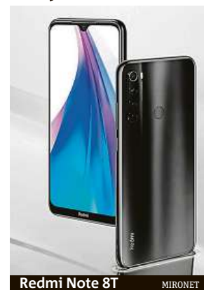
Redmi Note 8T MIRONET

A na kolik vás Xiaomi Redmi Note 8T přijde? Věřte nevěřte, v internetovém obchodě Mironet se prodává již od 4756 korun. Za tuto cenu dostanete skvěle vybavený telefon, který vám dlouho vydrží dělat radost.