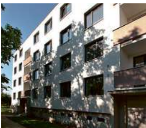
Bytový dům, Brno-Črlice