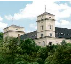
Zámek Račice, přestavba