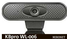
KBpro WL-006 MIRONET

ta z nás se při videohovorech určitě setkala se špatnou kvalitou obrazového a zvukového přenosu. Jenže po webkamerách se okamžitě zaprášilo a zdálo se, že se jich snad už ani nedočkáme. Pokud se již delší dobu po kvalitní webkameře sháníte, v internetovém obchodě Mironet teď najdete žhavou novinku za skvělou cenu.