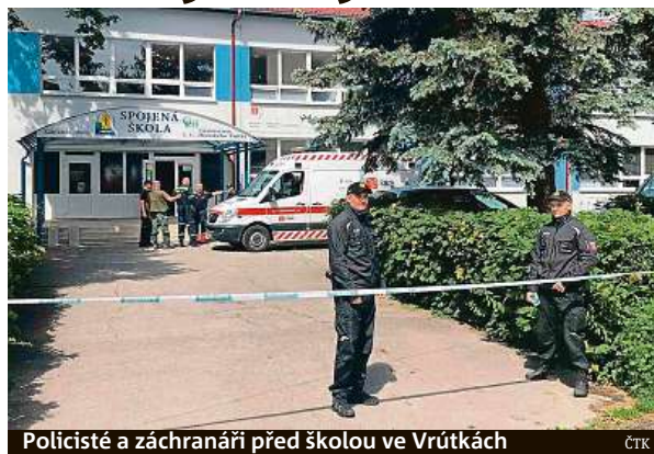
Policisté a záchranáři před školou ve Vrútkách