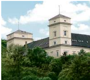
Zámek Račice, přestavba