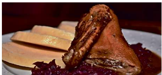
Čtvrťka pečené kačeny se zelím 160 Kč / za 2 porce

V eFiShopu nabízíme také teplá jídla určená k okamžité spotřebě rozvážená v menu boxech, delikatesy a základní potraviny.