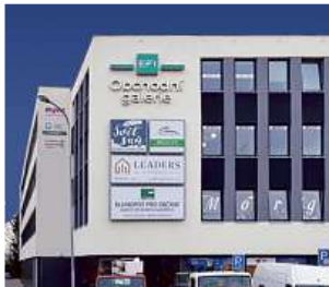
Obchodní galerie, Jihlava