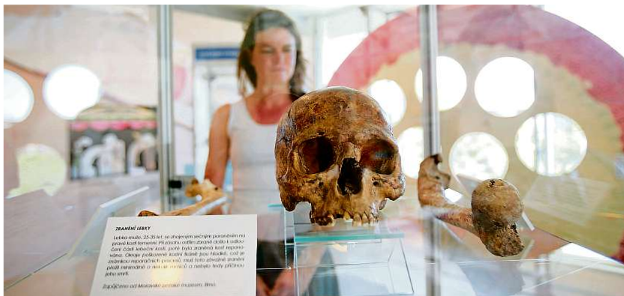
Až do konce září je v Technickém muzeu výstava Až na kost! Stovka exponátů přibližuje fungování kostí i jejich onemocnění.