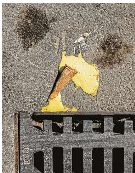
Fascinace barvami a tvary zmrzlin na zemi