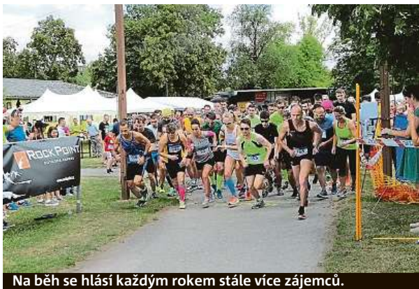
Na běh se hlásí každým rokem stále více zájemců.

Na vítěze hlavních kategorií čeká vyvažování vínem, odměnou jim tedy bude tolik vína, kolik sami váží. „Rádi bychom navázali na loňský