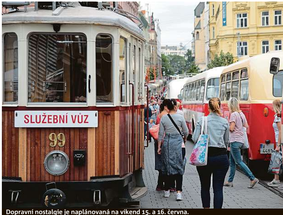
Dopravní nostalgie je naplánovaná na víkend 15. a 16. června.

Kdo se v sobotu vydá některým z historických vozů do Husovic, může v zábavě pokračovat. V husovické vozovně se bude odehrávat další program zaměřený především na trolejbusy. Dopravní podnik si totiž v letošním roce nepřipomíná jen 150 let MHD, ale také 70 let trolejbusové dopravy v Brně a 90 let vozovny Husovice. Kromě výstav trolejbusů zde budou probíhat okružní jízdy moderním parciálním trolejbusem včetně průjezdu mycím boxem a děti se vyřádí na autobusových a tramvajových trenažérech. RADEK BABIČKA