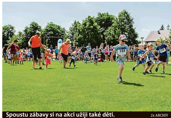
Spoustu zábavy si na akci užijí také děti.