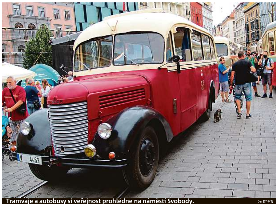
Tramvaje a autobusy si veřejnost prohlédne na náměstí Svobody.