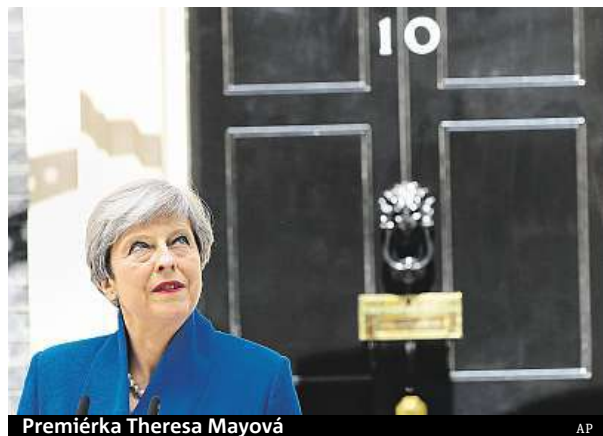
Premiérka Theresa Mayová

Jako dlouhodobě neudržitelnou vidí pozici Mayové v úřadu premiérky i další členka její Konzervativní strany, která v parlamentních volbách tento týden ztratila parlamentní většinu. Za šéfu své strany se naopak postavil ministr obrany Michael Fallon, který nicméně přiznal, že Mayová bude muset změnit přístup k ostatním členům vlády. „Doufám, že uvidíme více kolektivní přístup v rozhodování v kabinetu. Já a další moji kolegové jsme jí to dali jasně najevo,“ řekl Fallon. MET, ČTK