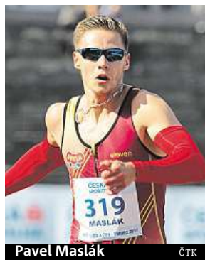
Pavel Maslák

Oštěpařka Barbora Špotáková poprvé v sezoně hodila za 64 metrů, stabilní výkonost potvrdil Jakub Vadlejš, který vyhrál hod oštěpem výkonem 87,07 metru. „Hodil jsem dál než na Diamantové lize. Bylo to o jednom metu, ale nemůžu závod hodnotit záporně,“ řekl Vadlejš.