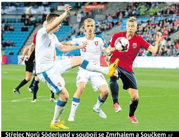
Štřelec Norů Söderlund v souboji se Zmrhalem a Součkem

Čeští fotbalisté mají čtyři kola před konce v tabulce skupiny C na třetím místě devět bodů, ale na druhé Severní Irsko, které vyhrálo v Ázerbájdžánu 1:0, ztrácí čtyři body. Právě z druhé pozice vede cesta do baráže. Češi by tak museli ze zbývajících zápasů uspět ve všech včetně duelu s Německem.