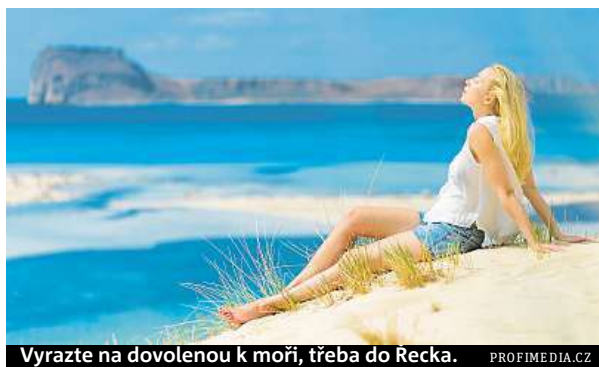
Vyrazte na dovolenou k moři, třeba do Řecka.

Několikanásobně vyšší zájem mají turisté letos i o cesty