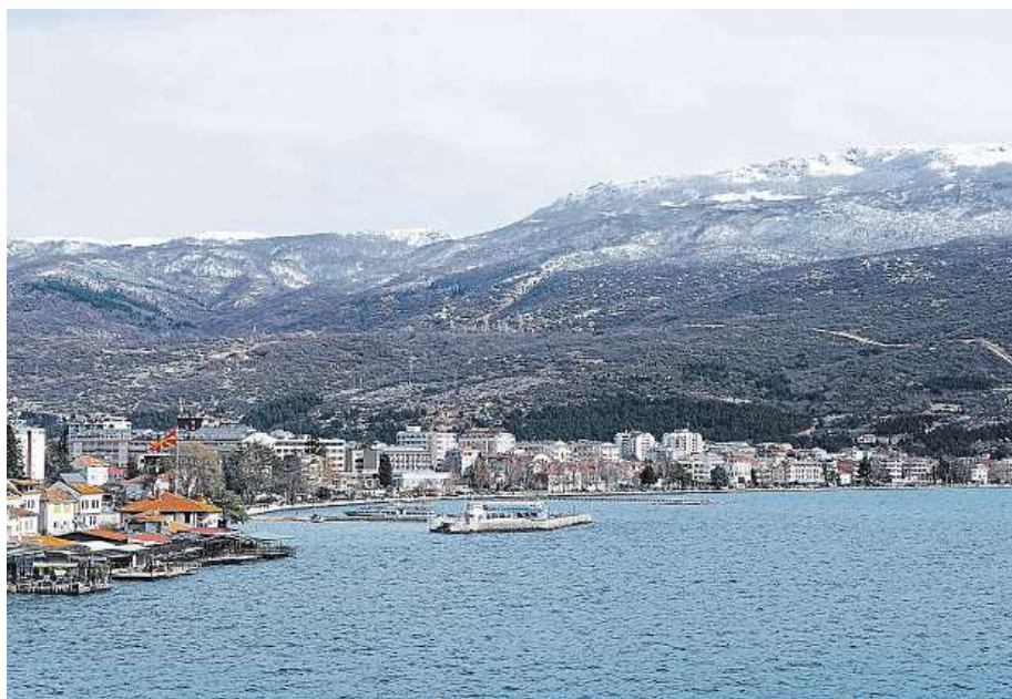
Ochridské jezero se zasněženými horami v pozadí.

Roku 1998 Ochridský Plavecký maraton vstoupil do Světového Plaveckého klubu pod záštitou FINA – Světové plavecké asociace.