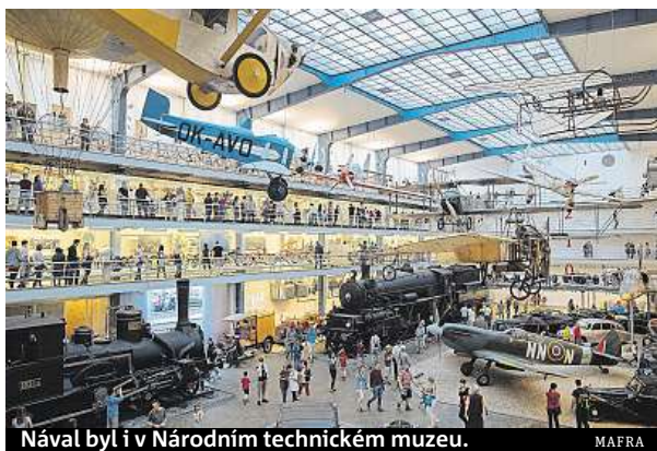
Nával byl i v Národním technickém muzeu. MAFRA

Letecké muzeum Kbely, Národní technické muzeum, Muzeum Policie České republiky nebo Botanická zahrada. To byla místa, která v sobotu nejvíce táhla během Pražské muzejní noci. Vstupů organizátoři zaznamenali zhruba o deset tisíc více než loni.