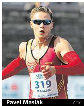
Pavel Maslák

Oštěpařka Barbora Špotáková poprvé v sezoně hodila za 64 metrů, stabilní výkonost potvrdil Jakub Vadlejš, který vyhrál hod oštěpem výkonem 87,07 metru. „Hodil jsem dál než na Diamantové lize. Bylo to o jednom metu, ale nemůžu závod hodnotit záporně,“ řekl Vadlejš.