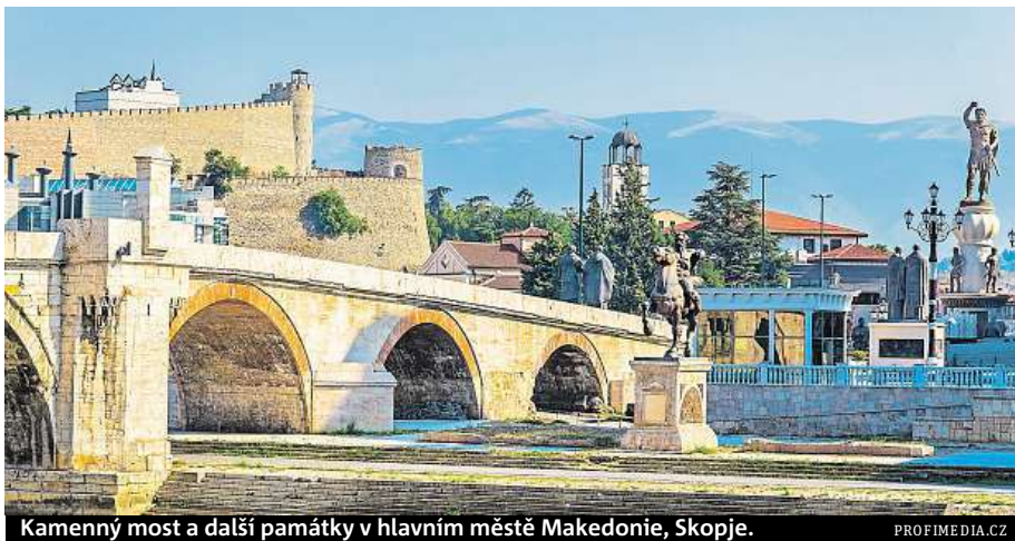
Kamenný most a další památky v hlavním městě Makedonie, Skopje.

Pokud budete ve Skopje během srpna, nenechte si ujít fotbalový zápas o evropský Superpohár mezi Realem Madrid a Manchesterem United na stadionu Filipa II.