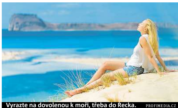
Vyrazte na dovolenou k moři, třeba do Řecka.

Několikanásobně vyšší zájem mají turisté letos i o cesty