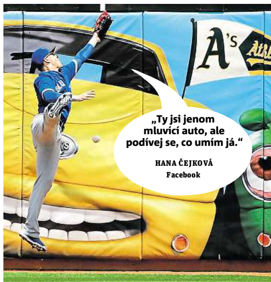
HANA ČEJKOVÁ Facebook

Napište bublinu a reagujte na sloupek na: www.facebook.com/denikmetro