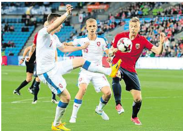
Štřelec Norů Söderlund v souboji se Zmrhalem a Součkem

Čeští fotbalisté mají čtyři kola před konce v tabulce skupiny C na třetím místě devět bodů, ale na druhé Severní Irsko, které vyhrálo v Ázerbájdžánu 1:0, ztrácí čtyři body. Právě z druhé pozice vede cesta do baráže. Češi by tak museli ze zbývajících zápasů uspět ve všech včetně duelu s Německem.