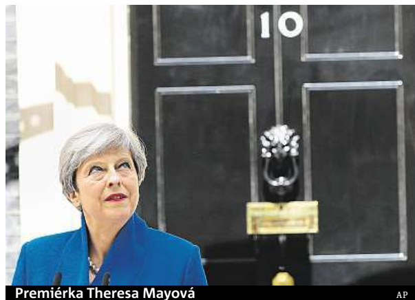
Premiérka Theresa Mayová

Jako dlouhodobě neudržitelnou vidí pozici Mayové v úřadu premiérky i další členka její Konzervativní strany, která v parlamentních volbách tento týden ztratila parlamentní většinu. Za šéfu své strany se naopak postavil ministr obrany Michael Fallon, který nicméně přiznal, že Mayová bude muset změnit přístup k ostatním členům vlády. „Doufám, že uvidíme více kolektivní přístup v rozhodování v kabinetu. Já a další moji kolegové jsme jí to dali jasně najevo,“ řekl Fallon. MET, ČTK