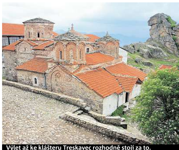
Výlet až ke klášteru Treskavec rozhodně stojí za to.