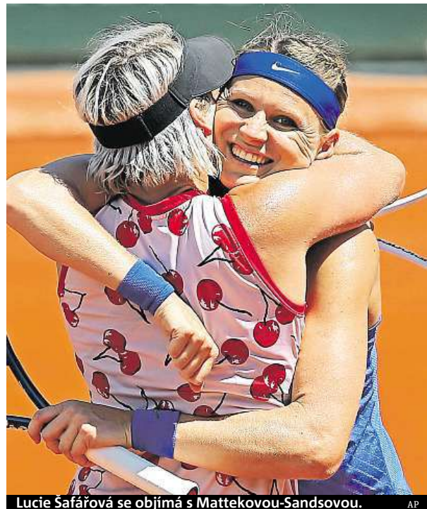
Lucie Šafářová se objímá s Mattekovou-Sandsovou. AP

„Hraji co nejlépe všude, ale tady jsou moje pocity nepopsatelné a nesrovnatelné s ničím jiným. Tenhle turnaj je nejdůležitější v mé kariéře,“ pronesl Nadal po svém triumfu. Získal za něj 2,1 milionu eur, v přepočtu přes 55 milionů korun. ČTK