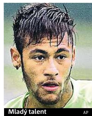
Mladý talent AP

Prakticky od chvíle, co obul kopačky, byl brazilský talent Neymar přirovnáván k legendárnímu Pelému. A na mistrovství světa má dvaadvacetiletý fotbalista jedinečnou šanci začít velká očekávání plnit a slavného krajana napodobit. Pelé při prvním startu na mistrovství světa v roce 1958 hned pomohl Brazílii k triumfu. „Když bude Neymar zdravý, může dokázat to samé,“ prohlásil bývalý kanonýr Ronaldo. ČTK