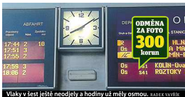
Vlaky v šest ještě neodjely a hodiny už měly osmou. RADEK VAVŘÍK

Na železnici dějou se věc, zpívá se v Cimrmanově hře Švestka. Slova písně potvrzují i hodiny na nádraží Praha-Libeň. Nádraží posouvají o dvě časová pásma a z pražského času je rázem moskevský, petrohradský nebo možná keňský. „Na nádraží v Libni už více než dva týdny hodiny ukazují špatně