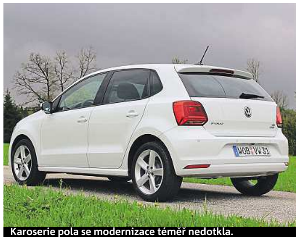
Karoserie pola se modernizace téměř nedotkla.