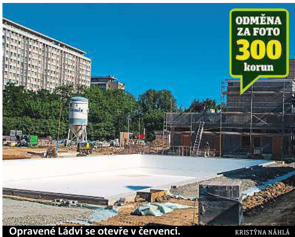
Opravené Ládvi se otevře v červenci.