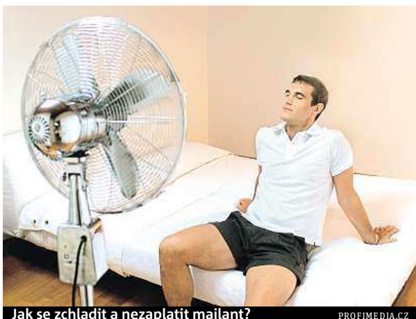
Jak se zchladit a nezaplátit majlant?

V parných dnech vymýšlíme, jak se zchladit. Někteří tak mají na zahradě bazén s čističkou, jiní zase doma používají větráky či klimatizaci. „Spotřeba klimatizační jednotky se v parném létě může klidně vyrovnat přímotopu v zimě,“ říká odborník přes energetiku společnosti PricewaterhouseCoopers Tomáš Bašta.