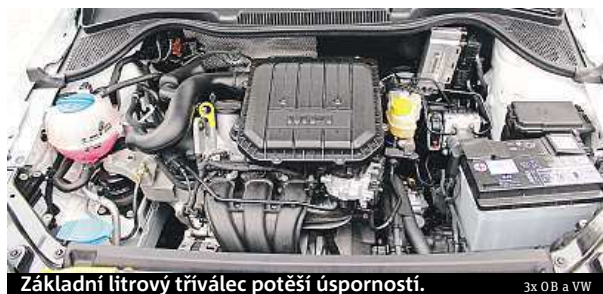
Základní litrový tříválec potěší úsporností.