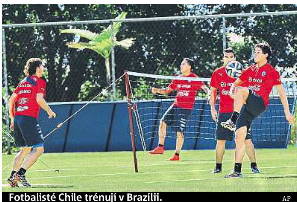
Fotbalisté Chile trénují v Brazílii.

Brazilci ale vůbec nemají lehkou roli. Nejen že jsou favority úvodního utkání, ale domácí fanoušci si nepřipouštějí nic jiného, než že kanárci na konci šampionátu 13. července zvednou nad hlavy pohár pro světové šampiony. „Tady v Brazílii máme pouze