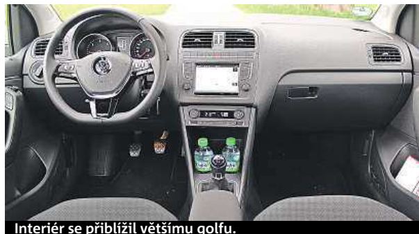
Interiér se přiblížil většímu golfu.