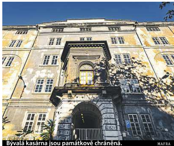
Bývalá kasárna jsou památkově chráněná.

Zájemci budou mít na podání nabídek 37 dní a ministerstvo už vypsalo i termíny prohlídky pro případné zájemce. S nabídkou přímo oslovila přes 70 developerů. ČTK, ROW