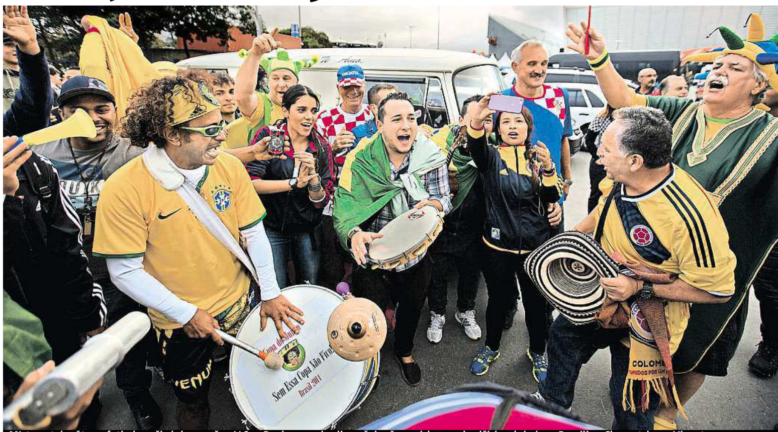
Mistrovství světa ve fotbale začíná dnes večer. V Sao Paulu ve 22 hodin našeho času pískne rozhodčí úvodní zápas Brazílie s Chorvatskem. Více strany 5 a 9