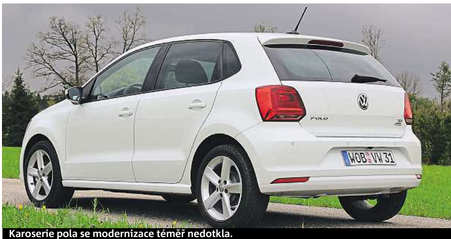
Karoserie pola se modernizace téměř nedotkla.

Teď už sedíme v pětidveřovém polu, ale pod kapotou vrčí základní verze benzinového tříválcového se 44 kW. Tě Čechy importér zatím ušetřil, ale uvažuje o jejím dovozu