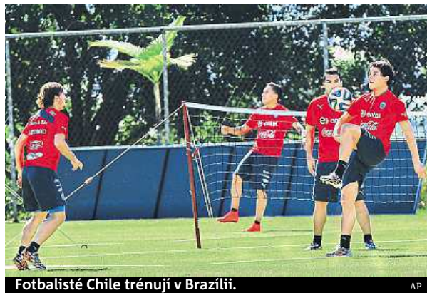
Fotbalisté Chile trénují v Brazílii.

Brazilci ale vůbec nemají lehkou roli. Nejen že jsou favority úvodního utkání, ale domácí fanoušci si nepřipouštějí nic jiného, než že kanárci na konci šampionátu 13. července zvednou nad hlavy pohár pro světové šampiony. „Tady v Brazílii máme pouze