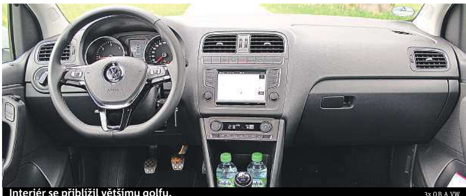
Interiér se přiblížil většímu golfu.