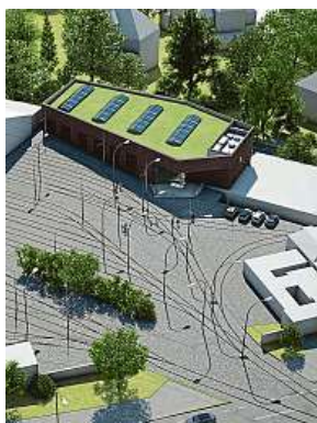
Muzeum chystá stavbu nové zelenohnědé výstavní haly. DPP

VŽDY LEVNĚ = zboží nabízené v našem letáku za výhodnou cenu opakovaně nebo mimořádně do vyprodání zásob. Za tiskové chyby neručíme. Prodej jen v množství obvyklém pro domácnost. Všechna foto jsou pouze ilustrační. Kompletní nabídka také na www.kaufland.cz