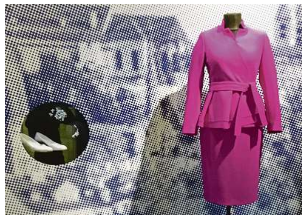
První dámu Evu Pavlovou můžete potkat skrze její inaugurační kostým a lodičky. Pro ženy se stává novou módní ikonou. 5x METRO