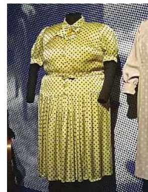
Soudružka Marta Gottwaldová si nechala říkat „milostpaní“.

sportovní košile „ve stylu Ivany Zemanové“. Dagmar Havlová nebo Livia Klausová byly k vystavovatelům štedřejší.