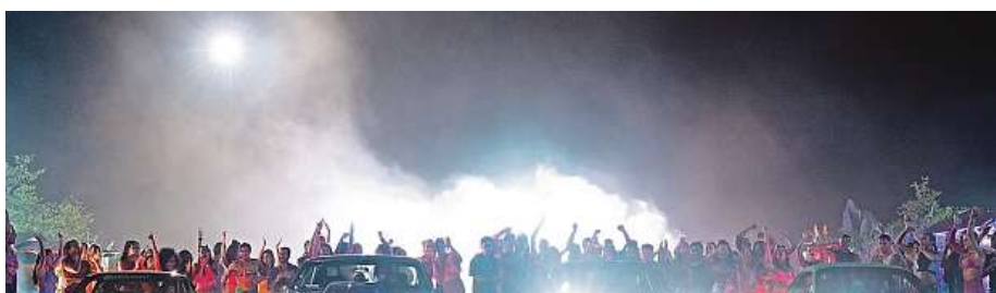
Rychle a zběsile, jedna z nejdelších filmových ság, píše svou patrně předposlední oficiální kapitolu. V ní hrdinům v čele s Dieselem osud přehrávají do cesty dosud nejzářadnějšího nepřítele.