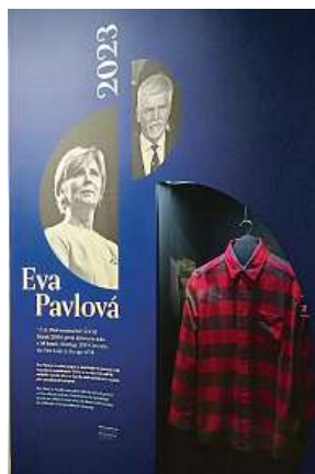
Pánský styl najdete v originální předprezidentské fanelce.

„Oblečení vypovídá, jací jsme, a také, jak chceme, aby nás ostatní viděli,“ komentuje výstavu kurátorka Miroslava Burianová. Každá z našich prvních dam udávala nějaký styl daný dobou i politikou. Jak partnerky prezidentů ne snadnou roli prožívaly? „Zkuste si představit, a mírím na ženy, že se ráno probudíte a uvědomíte si, že jste se ze ze na den staly první dámou,“ říká kurátorka. Přesvědčit se o tom můžete až do dubna 2023. PAVEL HRABICA