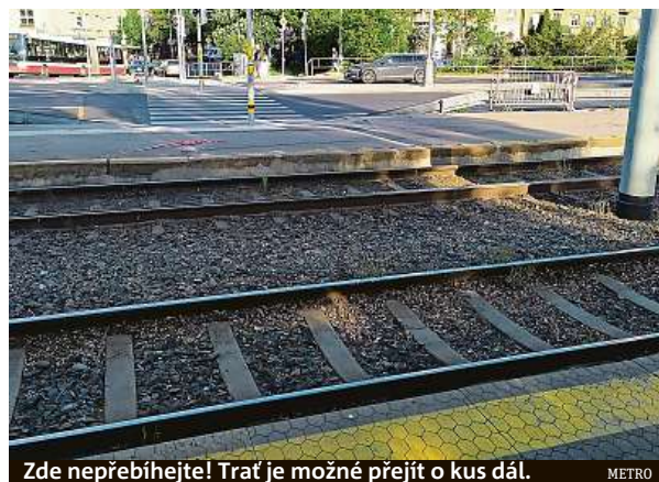
Zde nepřebíhejte! Trať je možné přejít o kus dál.

Mluvčí Prahy 4 Jiří Bigas také upozornil, že nebezpečí pro tramvaj dobíhající chodce nemusí číhat jen přímo na přechodu. „S legalizací stavby musí dopravní podnik vyřešit bezpečnostní opatření v kolejišti tramvajové trati tak, aby lidé mezi nástupištěm nevstupovali do kolejiště mimo určené místo, protože