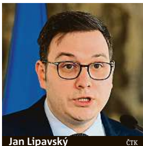
Jan Lipavský

Účast v ženevském sídle UNHRC je velkým úspěchem české diplomacie, jež v Radě nahradila Rusko, jehož členství bylo pozastaveno. „Já vnímám symboliku toho, že jsme nahradili Ruskou federaci, která se dopouští odporých zločinů proti Ukrajině,“ uvedl ministr zahraničí Jan Lipavský. Na něj navázal ministr vnitra Vít Rakušan: „Pro Českou republiku je to šance světu ukázat naši jasnou humanistickou orientaci v duchu nejlepších tradic Tomáše