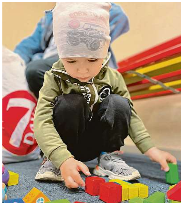
Děti při hře zapomenou na starosti.

Přes klesající zájem přispět lidem v nouzi se najdou tací, kteří dále pomáhají. Nedaleko nově zřízeného pražského asistenčního centra pomoci ve Vysočanech sídlí spolek Vraťme dětem úsměv. Dobrovolníci se snaží ukrajinským dětem zpříjemnit čekání ve frontách před krajskými centry a pomocí výtvarných potřeb je na chvíli zabavit. VERONIKA REICHELTOVÁ