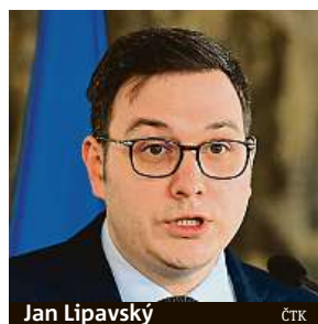
Jan Lipavský

Účast v ženevském sídle UNHRC je velkým úspěchem české diplomacie, jež v Radě nahradila Rusko, jehož členství bylo pozastaveno. „Já vnímám symboliku toho, že jsme nahradili Ruskou federaci, která se dopouští odporých zločinů proti Ukrajině,“ uvedl ministr zahraničí Jan Lipavský. Na něj navázal ministr vnitra Vít Rakušan: „Pro Českou republiku je to šance světu ukázat naši jasnou humanistickou orientaci v duchu nejlepších tradic Tomáše