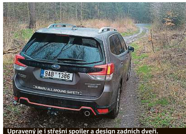
Upravený je i střešní spoiler a design zadních dveří.

vrásek nám neudělalo ani mazlavé bahno, které bylo na cestě za ní. Motor s výkonem 150 koní se opírá o vylepšené funkce režimu X-Mode, který využívá naplno trakci všech kol. Novinkou je také to, že se po překročení rychlosti 40 km/h sám vypne, takže na to řidič nemusí myslet. Při zpomalení se opět aktivuje. A když detekuje nízkou rychlost společně s prudkým klesáním, aktivuje se asistent pro sjíždění prudkých svahů. To se hodí například ve chvíli, kdy se řidič trochu obává rokle před sebou a příliš bojačně šlape na brzdou. Pak se může stát, že se auto vážící