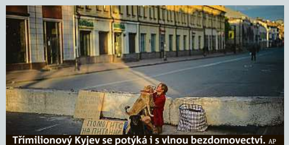
Třímilionový Kyjev se potýká i s vlnou bezdomovectví.