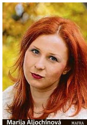
Marija Aljochinová

Rusovlasá členka Pussy Riot oklamala ruské muže zákona. Díky povedenému převleku už je v bezpečí Evropské unie.