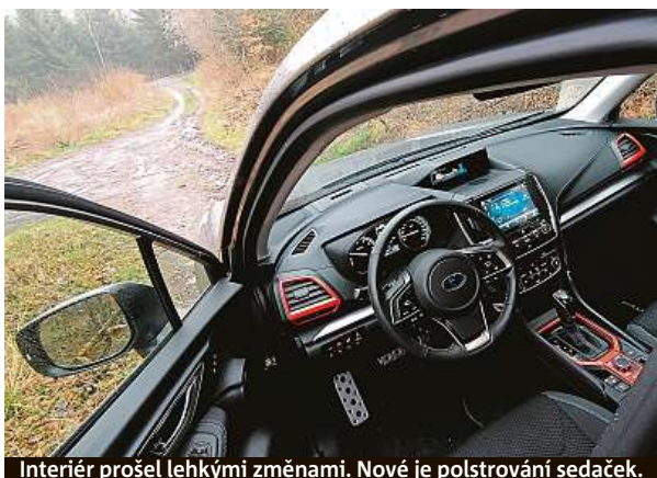
Interiér prošel lehkými změnami. Nové je polstrování sedaček.

Modelový rok 2022 není u oblíbeného modelu Subaru nějakou velkou revolucí, spíš jen modernizací, ale ve všech ohledech správným směrem. Pátá generace auta vyráběného od roku 1997 má jinak stavěnou masku chladiče, i design předního nárazníku se změnil. Světla jsou výraznější a celkově je charakter auta víc drsnácký. K tomu při-