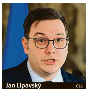
Jan Lipavský

Účast v ženevském sídle UNHRC je velkým úspěchem české diplomacie, jež v Radě nahradila Rusko, jehož členství bylo pozastaveno. „Já vnímám symboliku toho, že jsme nahradili Ruskou federaci, která se dopouští odporých zločinů proti Ukrajině,“ uvedl ministr zahraničí Jan Lipavský. Na něj navázal ministr vnitra Vít Rakušan: „Pro Českou republiku je to šance světu ukázat naši jasnou humanistickou orientaci v duchu nejlepších tradic Tomáše