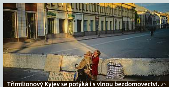
Třímilionový Kyjev se potýká i s vlnou bezdomovectví.