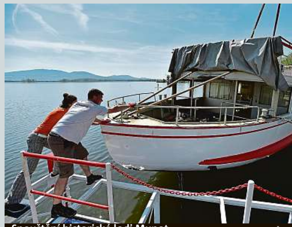
Spouštění historické lodi Munot

V Česku zahájila provoz virtuální klinika zaměřená na poskytování služeb telemedicíny pacientům. Společnost pacientům nabízí vzdálený monitoring životních funkcí a nástroje na prevenci onemocnění. Na dálku umožňuje pomocí přístrojů sledovat hladinu cukru, tlak krve, srdeční aktivitu či funkčnost plic. ČTK