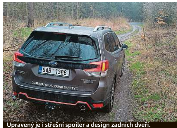
Upravený je i střešní spoiler a design zadních dveří.

vrásek nám neudělalo ani mazlavé bahno, které bylo na cestě za ní. Motor s výkonem 150 koní se opírá o vylepšené funkce režimu X-Mode, který využívá naplno trakci všech kol. Novinkou je také to, že se po překročení rychlosti 40 km/h sám vypne, takže na to řidič nemusí myslet. Při zpomalení se opět aktivuje. A když detekuje nízkou rychlost společně s prudkým klesáním, aktivuje se asistent pro sjíždění prudkých svahů. To se hodí například ve chvíli, kdy se řidič trochu obává rokle před sebou a příliš bojačně šlape na brzdou. Pak se může stát, že se auto vážící