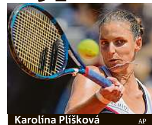
Karolína Plíšková

Česká tenistka Karolína Plíšková prohrála ve druhém kole antukového turnaje v Římě s Jil Teichmannovou 2:6, 6:4, 4:6 a nenavázala na tři finálové účasti z minulých ročníků. Třicetiletá světová šestka podlehla o šest let mladší švýcarské soupeřce podruhé v kariéře. ČTK