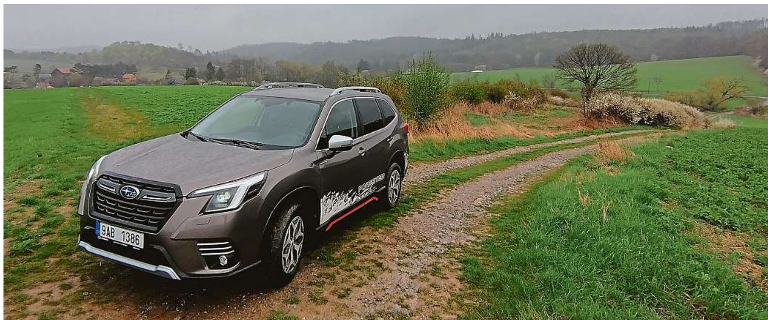
Nový Forester má výrazně tužší karoserii, což znamená, že se v terénu nijak nekroučí. Nové jsou i přední pružiny, takže i na poli je auto pohodlné.