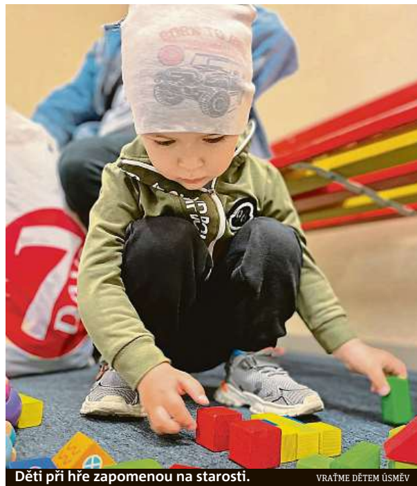
Děti při hře zapomenou na starosti.

Přes klesající zájem přispět lidem v nouzi se najdou tací, kteří dále pomáhají. Nedaleko nově zřízeného pražského asistenčního centra pomoci ve Vysočanech sídlí spolek Vraťme dětem úsměv. Dobrovolníci se snaží ukrajinským dětem zpříjemnit čekání ve frontách před krajskými centry a pomocí výtvarných potřeb je na chvíli zabavit. VERONIKA REICHELTOVÁ