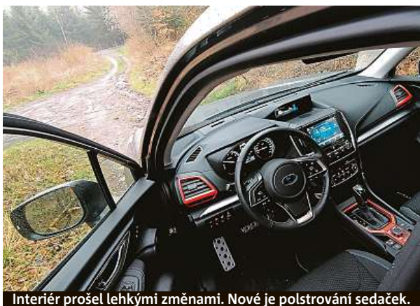
Interiér prošel lehkými změnami. Nové je polstrování sedaček.

Modelový rok 2022 není u oblíbeného modelu Subaru nějakou velkou revolucí, spíš jen modernizací, ale ve všech ohledech správným směrem. Pátá generace auta vyráběného od roku 1997 má jinak stavěnou masku chladiče, i design předního nárazníku se změnil. Světla jsou výraznější a celkově je charakter auta víc drsnácký. K tomu při-