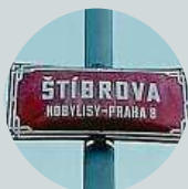
Zbyněk Štíbr Hluk na ulici do pozdních nočních hodin.