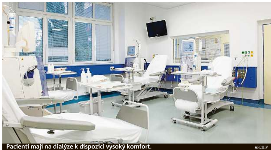
Pacienti mají na dialýze k dispozici vysoký komfort.

Pacienti mají k dispozici vysoký komfort – mohou sledovat televizi, využívat wi-fi připojení k internetu, své problémy mohou diskutovat s psychologkou nebo sociální pracovníci, pro otázky kolem jídelníčku a pitného režimu je jim k dispozici nutriční sestra. MET