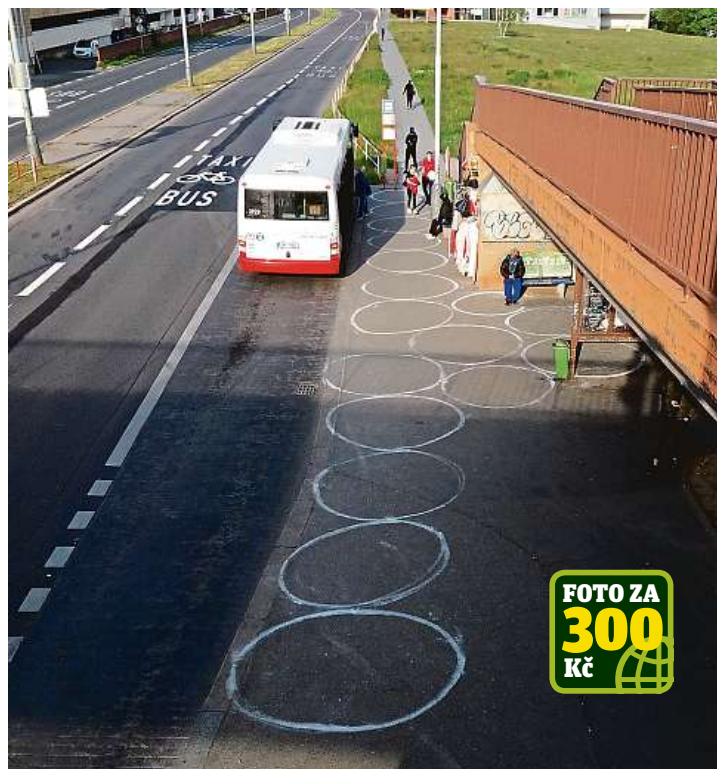
FOTO ZA 300 Kč