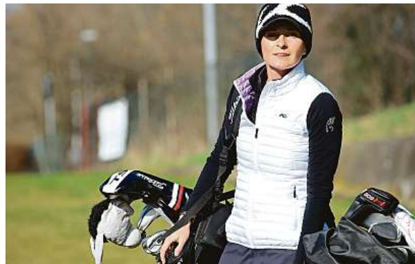
Během golfování se dá ujit až dvanáct kilometrů.

Ano. Mám několik nadějných mladých svěřenců, kterým se snažím předávat své zkušenosti. S taškou doufáme, že budeme na konci srpna moci uspořádat druhý ročník Tipsport Czech Ladies Open, což je ženský golfový turnaj nejvyšší evropské sou-