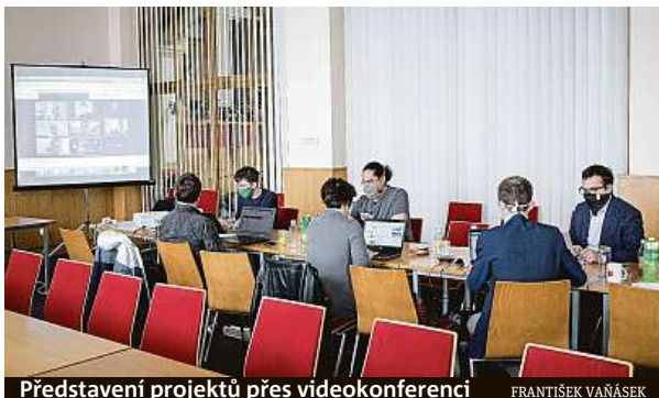
Představení projektů přes videokonferenci

Účastníci si na začátku mohli vybírat ze šesti témat, která magistrát připravil. Příkladem je legalizace a monitorování reklamy v centru,