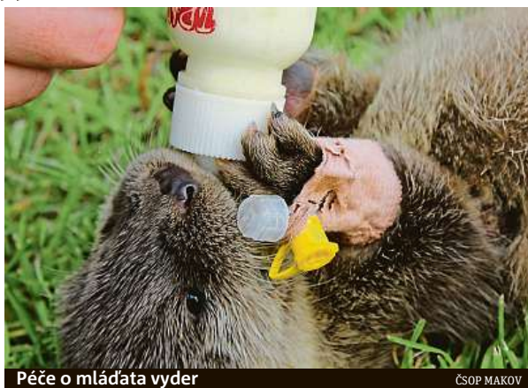
Péče o mláďata vyder

Na volně žijící zvířata mají negativní dopad také nařízená omezení proti šíření koronaviru. Lidé totiž začali daleko více hromadně vyrážet do přírody. Podle zástupců Zá-