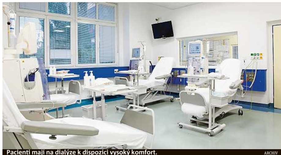
Pacienti mají na dialýze k dispozici vysoký komfort.

Pacienti mají k dispozici vysoký komfort – mohou sledovat televizi, využívat wi-fi připojení k internetu, své problémy mohou diskutovat s psychologkou nebo sociální pracovníci, pro otázky kolem jídelníčku a pitného režimu je jim k dispozici nutriční sestra. MET